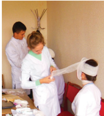
Fig. 1. Applying bandages

Results and discussion. At the first (preparatory) stage of the lesson, the teacher divided the students into three groups: general practitioners (Gr1gp), surgeons (Gr2s) and a group of arbiters (Gr3a), which should evaluate the results of the work of other groups. The groups consisted of 3-4 students. The group chose a leader, whose duties included the distribution of sections of the assignment among the members of the group, organizing the search for information, coordinating the receipt of solutions for individual sections, summarizing the information received and organizing a discussion in the group to obtain a general solution to the problem presented. The best students were included in the group of arbiters. At the second (main stage), the final decision of each group was presented in the form of a unified form, the decision was discussed by all students, other opinions were expressed, questions were posed by the students themselves and the teacher (leading clarifying, prepared in advance to create a discussion), the announcement of the final general solution of all students. The cooperative group method is used to find commonalities in various health care regimens for patients with burns (Fig. 1,2).