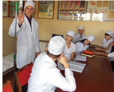
Fig. 2. Anti-shock therapy