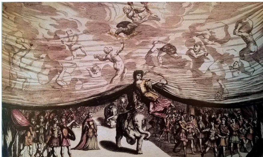
Slika 5. Prizor iz raskošne opere Antonija Cestija, Zlatna jabuka (Il pomo d'oro) izvedene u čast krunidbe cara Leopolda I. 1666.godine. Autor inscenacije je Ludovico Burnacini (1636.-1707.), a na njemu je vidljivo mnoštvo glumaca odjevenih u prepoznatljiv robe a la romaine/ habit a la romaine kazališni kostim.