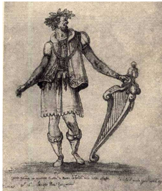
Slika 4. Prikaz Ariona iz petog intermedija Hodočasnice (La pellegrina) izvedene u Firenci 1589.g. Autor: Bernardo Buontalenti(1531.-1608.).