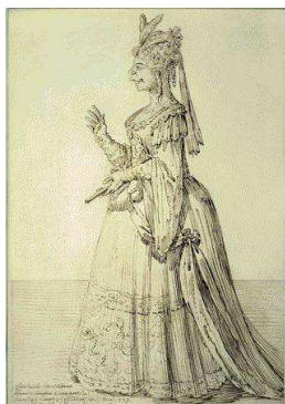
Slika 2. Castrat sopran Carlo Broschi- Farinelli (1705.-1782.) prikazan u ženskoj ulozi, u Rimu 1724.g. Autor karikature je Pier Leone Ghezzi (1674.-1755.)