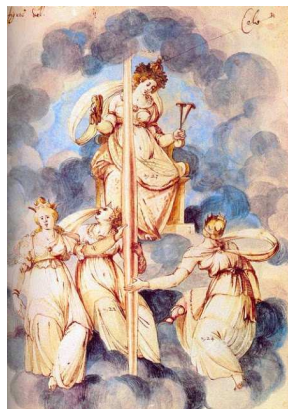
Slika 3. Prikaz intermedija iz predstave Hodočasnica (La pellegrina) izvedene u Firenci 1589.g. Autor: Bernardo Buontalenti (1531.-1608.). Na skici je lik Nužde posjednut iznad tri Parke .