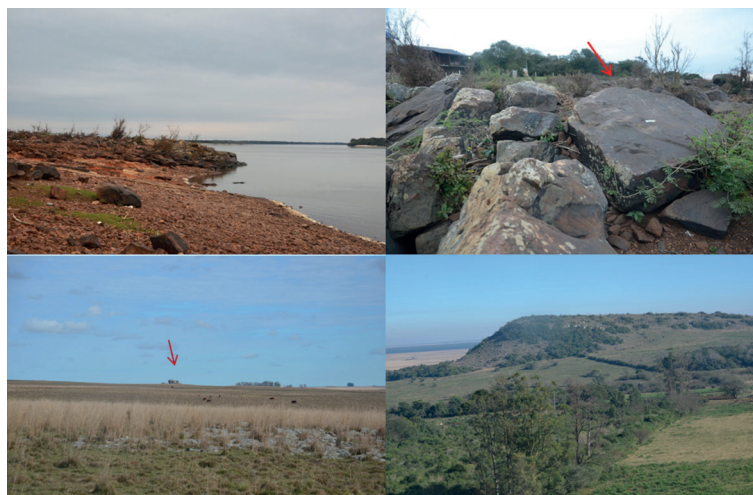
Figura 3. El entorno de los sitios. Arriba sitio El Remanso – Yapeyú, a la izquierda vista del río Uruguay, a la derecha bloque lítico con los grabados relevados. Abajo izquierda, relieve uniformemente llano en torno al sitio Itá Pucú. Abajo derecha, vista de la reserva de Tres Cerros.

área y describe la “roca de la Asunción” o la de la Ita Pucú como bloques de piedra arenisca aislados en un pequeño espacio en el centro de las planicies. Traduce Ita-pucu como Piedra-larga. Describe que la piedra larga se encuentra en el NE y las rocas que dependen de él, al SO, la arenisca es de color blanco grisáceo y grano fino (Demersay 1860-1865).