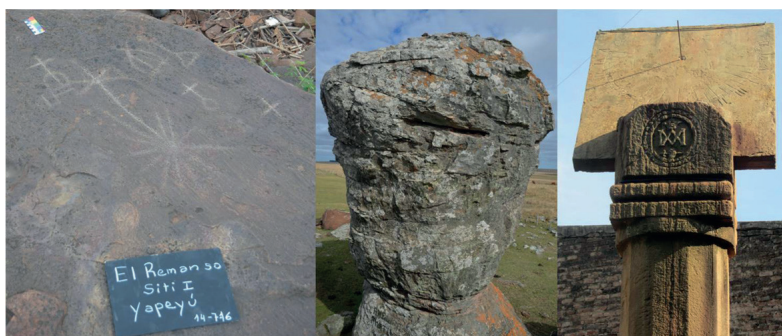
Figura 2. Izquierda: Sitio de grabados rupestres próximo al Río Uruguay. Centro: Itá Pucú, próximo a Mercedes, monumento natural. Derecha: Reloj solar jesuita en La Cruz.

En este sector, en terrenos de un campo privado, se encuentra Itá Pucú, próxima a la localidad de Mercedes, donde las creencias populares postulan que esta piedra crece (Figuras 2 y 3). Corresponde a la formación Paiubre y se encuentra a una altura de 116 msnm. Entre otros testimonios, Bonpland después de observar la ladera de las rocas, su composición y la presencia de líquenes que indica su antigüedad, consigna la declaración de un hombre que afirma haber visto a aumentar el volumen de la piedra. Demersay (1860-1865) asiste a Bonpland en sus contribuciones en esta