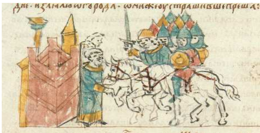
Мал. 2. Войска курскага князя Ізяслава Мсціславіча пад сценамі Лагойска, 1127 г. Мініяцюра Радзівілаўскага летапісу [9]