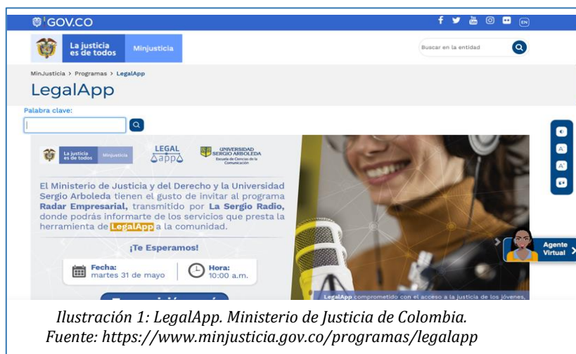
Ilustración 1: LegalApp. Ministerio de Justicia de Colombia.

En su Plan de Acción para 2015-2017, Colombia presentó el compromiso LegalApp: Servicios de interacción y manejo de fuentes de información para el sector Justicia , el cual buscaba promover la rendición de cuentas por parte de la rama judicial y facilitar el acceso del público a la información sobre los servicios de justicia con herramientas tecnológicas innovadoras. Con este compromiso se buscaba establecer los mejores