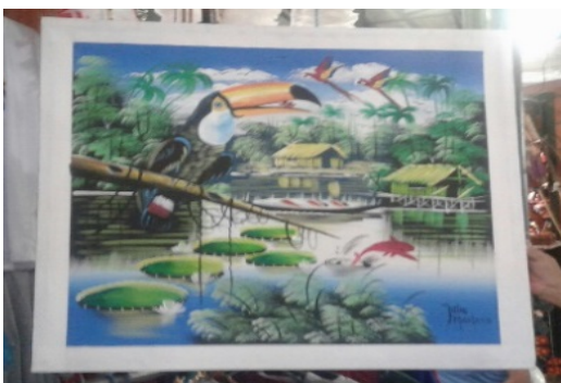
Figura 6 – Objeto no formato retângulo

A atividade intitulada de “Caça à geometria” também movimentou os estudantes, na tentativa de reconhecerem as figuras geométricas básicas nos produtos comercializados no Mercado Municipal. Em relato oral, uma acadêmica mencionou que a atividade fez com que ela começasse a perceber a presença das figuras geométricas em todos os objetos ao seu redor, o que influenciou o repasse dessa prática à sua filha de quatro anos de idade.