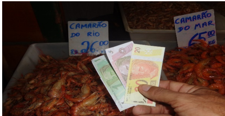
Figura 5 – Simulação de compra de camarão