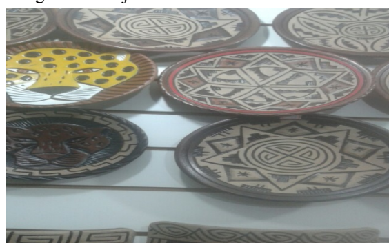
Figura 7 – Objeto no formato círculo