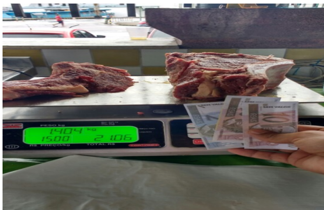
Figura 4 – Simulação de compra de carne

Jarandilha e Splendore (2010) acreditam ser essencial que o professor incentive o aluno a observar e a experimentar a matemática, tornando o ensino de matemática mais compreensível e prazeroso. Selbach (2015, p. 105) aponta que “muitas vezes a matemática trabalhada na escola se afasta da matemática de toda hora, esta sim carregada de sentido”.