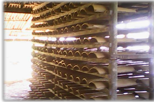
Figura 2 – Telhas nas parteleiras para secagem