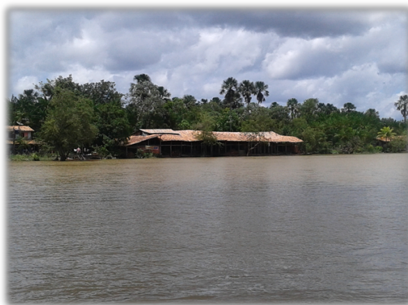
Figura 1 – Vista frontal da olaria

Para facilitar a produção, as olarias são construídas às margens dos rios e igarapés e possuem formato de chalé, conforme observamos na Figura 1. São cobertas com telhas ou palha e as paredes são constituídas pelas parteleiras 6 onde são colocadas as telhas e tijolos, que, antes de seguirem para o forno, vão secando mais rapidamente com a ajuda do vento e da temperatura natural.