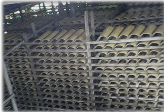
Figura 4 - Distribuição das telhas nos vãos produzidas numa olaria

Ao final da semana, o oleiro faz a soma das telhas, a fim de totalizar a produção semanal. Com isso, ele sabe se sua produção é suficiente para a fornada, ou seja, se a quantidade de telhas produzidas é bastante para completar a capacidade do forno e a sua tarefa.