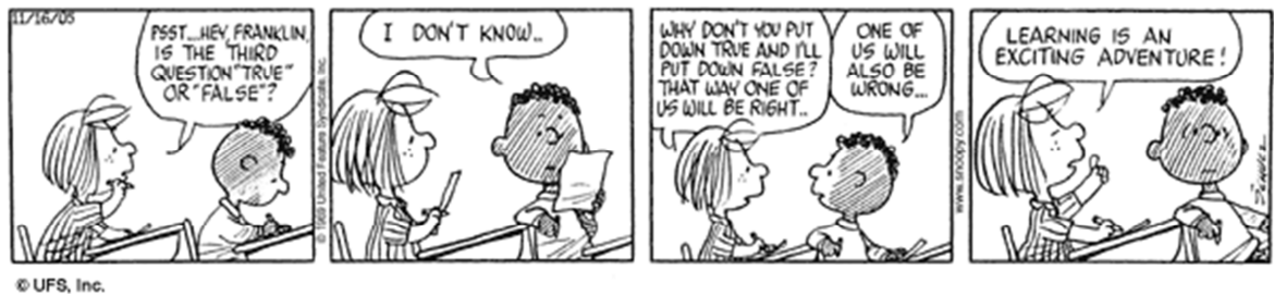
Figura 1 – Patty Pimentinha na escola. Série Peanuts. “Excitante”