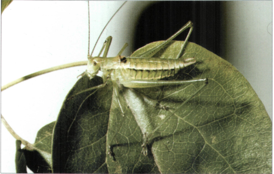
4. ábra: Leptophyes boscii hímje Bruner Von Wattenwyl 1878 nőstény