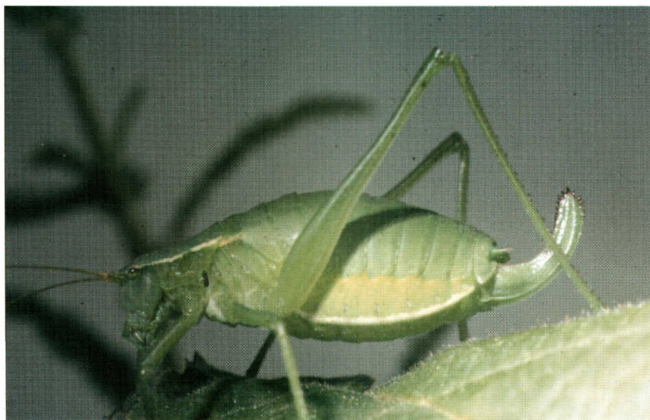
3. ábra: Isophya camptoxypha nősténye Brunner Von Wattenwyl, 1878 (=brevipennis)