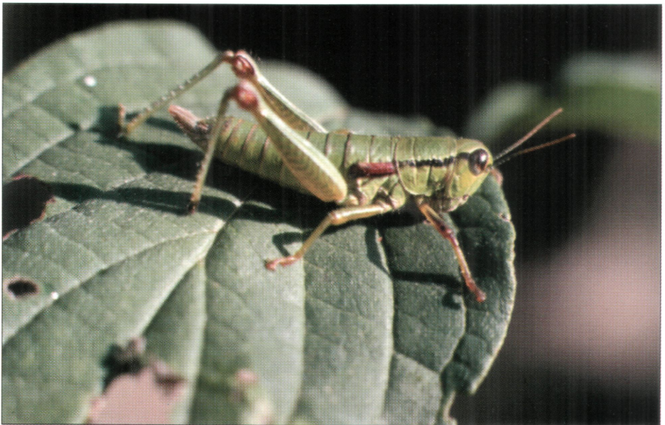
5. ábra: Odontopodisma decipiens Ramme, 1951 nőstény