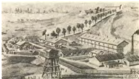
1. ábra. Az első Csepeli gyártelep János-legelőn 1892-ben [3]

Azért választottak mert közel volt Budapest, olcsó volt a munkaerő, illetve a telek bérleti díja. 1892-ben ide helyezték át az egész gyárat és már a