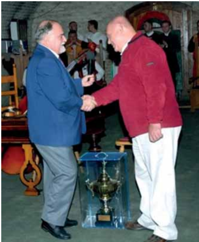
2009–2012 KÖZÖTT A MAGYAR UROLÓGUS TÁRSASÁG ELNÖKE. BEIKTATÁSA A MUT XIV. KONGRESSZUSÁN (KESZTHELY 2009) ÉS AZ ELNÖKI KUPA ÁTADÁSA