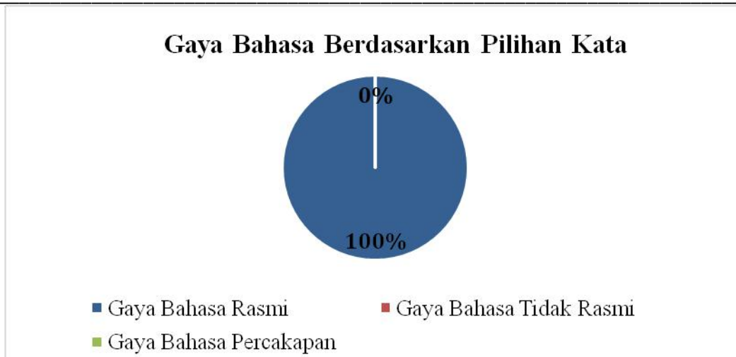
Carta 4.1: Gaya bahasa berdasarkan pilihan kata

Berdasarkan carta di atas, gaya bahasa berdasarkan pilihan kata mempunyai tiga pecahan kecil iaitu gaya bahasa rasmi, gaya bahasa tidak rasmi dan gaya bahasa percakapan. Pengkaji hanya menemukan gaya bahasa rasmi sahaja digunakan oleh DSISY. Bahasa rasmi dalam konteks Malaysia ialah bahasa baku. Menurut Tatabahasa Dewan (2009) bahasa baku ini telah menjadi norma kebahasaan bagi seluruh masyarakat yang mana bahasa ini juga telah mengalami proses pengekodan. Selain itu, bahasa baku ini digunakan apabila masyarakat dari pelbagai dialek berkumpul dan berbincang sama juga seperti sidang media harian Covid-19 yang melibatkan rakyat Malaysia dan wartawan yang ternanti-nanti perkembangan isu-isu berkaitan Covid-19. Antara contoh ucapan DSISY adalah seperti berikut: