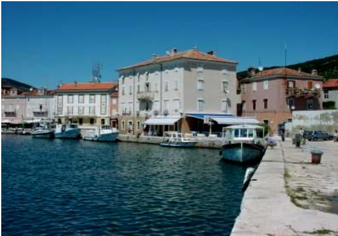
Slika 1: Zgrada na creskoj rivi u kojoj se nalazila ordinacija

Tijekom proteklih 20 godina djelovanja na Cresko-lošinjskom arhipelagu imala sam prilike sudjelovati u razvoju i provođenju zdravstvene skrbi kao i razvoju telemedicinske prakse od njenog začetka. Samostalni posao u privatnoj internističkoj ordinaciji započela sam u Cresu 1996. godine. Bila sam jedini specijalist interne medicine na šest otoka: Cresu, Lošinju, Iloviku, Susku, Malim i Velikim Srakanama. Prethodno sam provela deset godina u bolnicama KBC Rebro i KB Sestre Milosrdnice u Zagrebu.