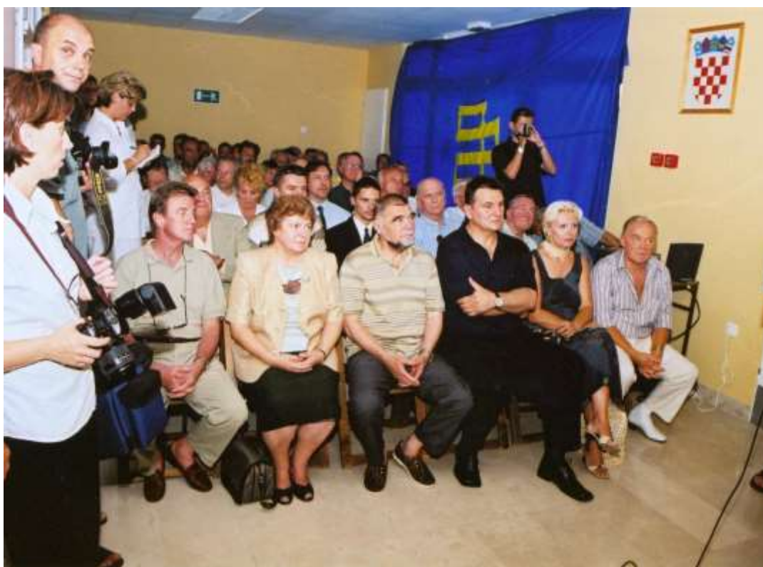
Slika 2: Otvorenje „Virtualne poliklinike“ i nove zdravstvene stanice u Cresu

Internet za konzultacije počela sam koristiti 1998. godine i pri tom se konzultirala s kolegama u bolnicama na kopnu. U početku su to bili samo osobni prijatelji i bliski kolege. Zahvaljujući suradnji sa AMZH 2000. godine realiziran je projekt „Virtualna poliklinika - specijalističko konzilijarna služba za otoke i ruralna područja“, čime je i službeno započela prva telemedicinska praksa na otocima u Hrvatskoj. Projekt je odobrilo Ministarstvo za znanost i tehnologiju. Službeno otvorenje „Virtualne poliklinike,, bilo je je 28. srpnja 2001.godine.