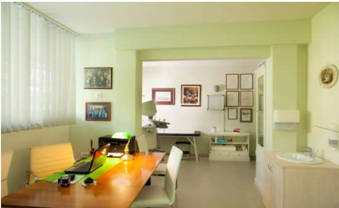
Slika 6: Specijalistička internistička ordinacija dr. Margan u Malom Lošinju

Iskustvo pokazuje da bi trebalo razvijati aplikacije za medicinske sestre i praćenje bolesnika u kući. Moguće je pratiti korištenje terapije, vitalne funkcije, laboratorijske parametre, elektrokardiogram, educirati bolesnike, konzultirati liječnike, educirati medicinsku sestru. Posljednjih godina malo se liječnika odlučuje provesti svoju profesionalnu karijeru na otocima. Osobito i nadalje nedostaje specijalista. Telemedicinske konzultacije i dijagnostika uspješno su ublažili probleme u nekim djelatnostima.