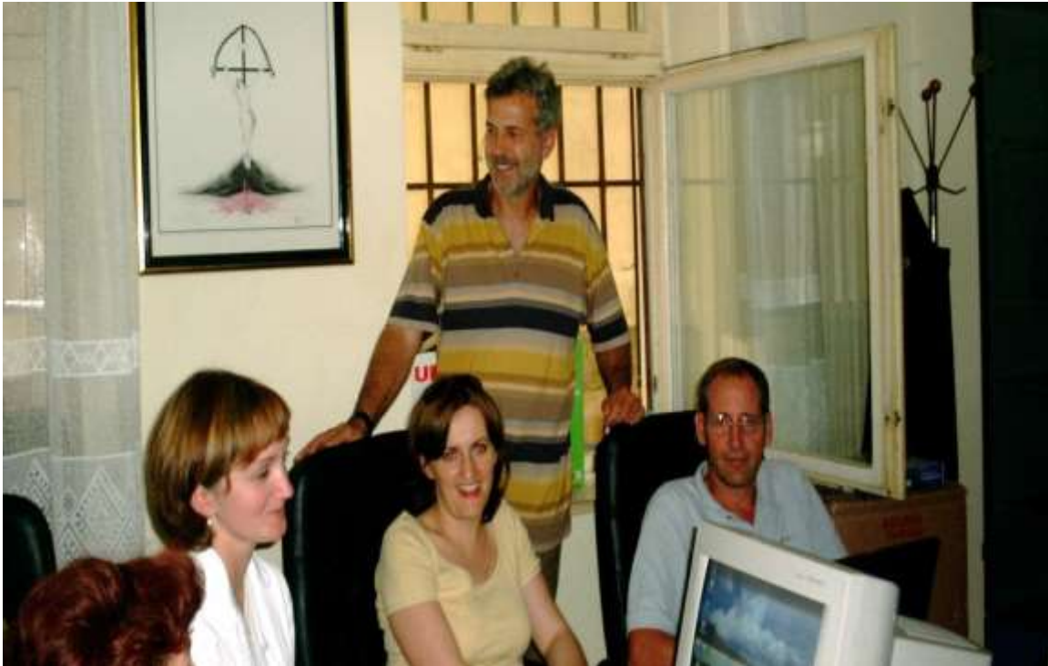
Slika 4: Otočka škola telemedicine u Domu zdravlja „Dr.Dinko Kozulić“

‘Ultrasonic Imaging and Signal Processing’ u San Diegu. Da bih održala predavanje na toj konferenciji projekt je morao proći oštru međunarodnu recenziju. Isto je bilo i na konferencijama koje je organizirala Europska komisija Eurolatis u Havani 2002. godine i u Sao Paulu 2003. godine kada je naš projekt ‘Virtualna poliklinika’ u jakoj međunarodnoj konkurenciji od 500 projekata bio uvršten u 15 prihvaćenih radova za financiranje i primjenu.