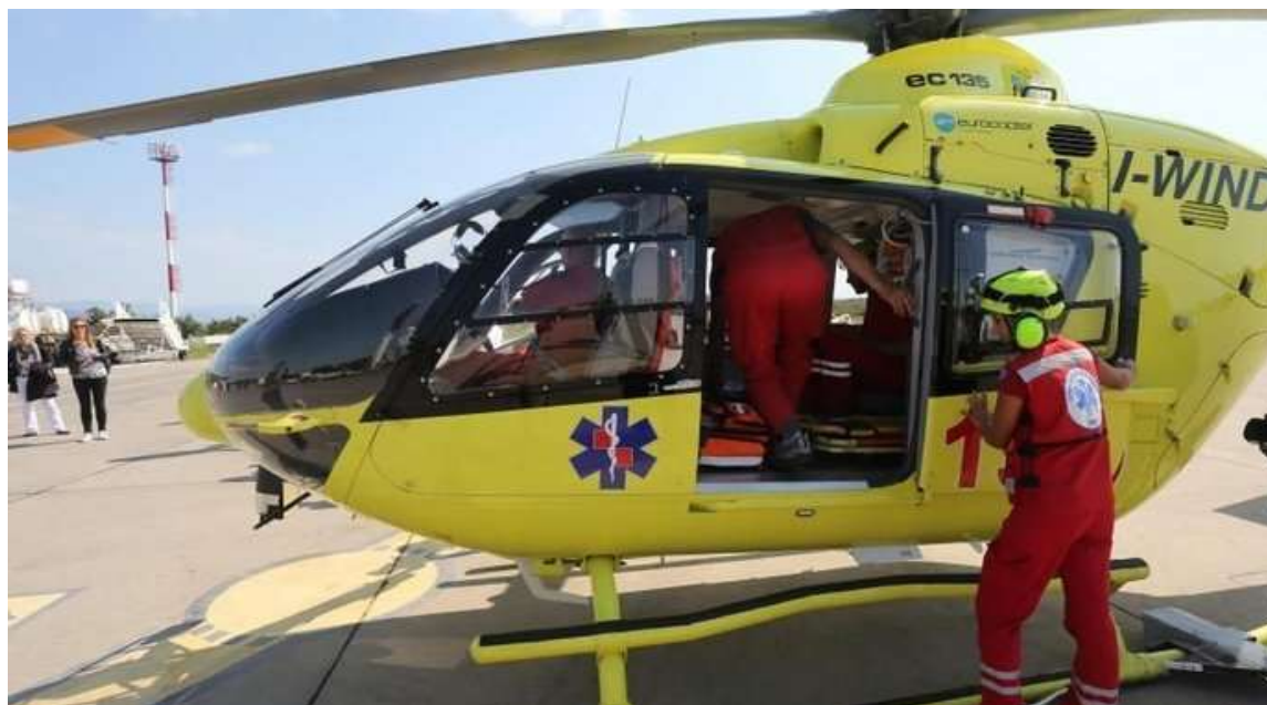
Slika 5: Hitna helikopterska služba

Tele EKG omogućio je i transporte bolesnika s infarktom miokarda unutar zlatnog standarda te tako poboljšao zdravstvenu sigurnost na otoku.