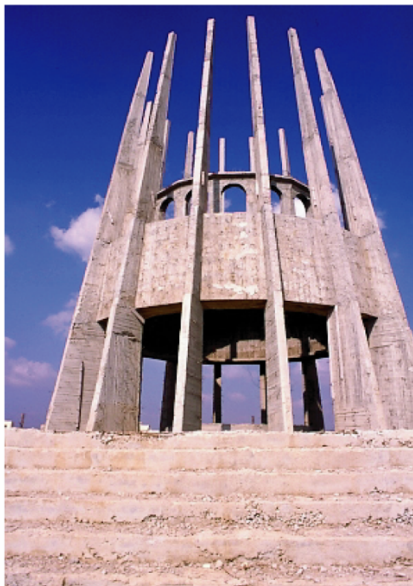
Vue n° 1 : mausolée de Sultan en 2000