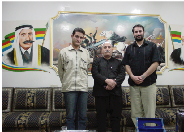
Vue n° 3 : madhafa Courbage (Jeramana)