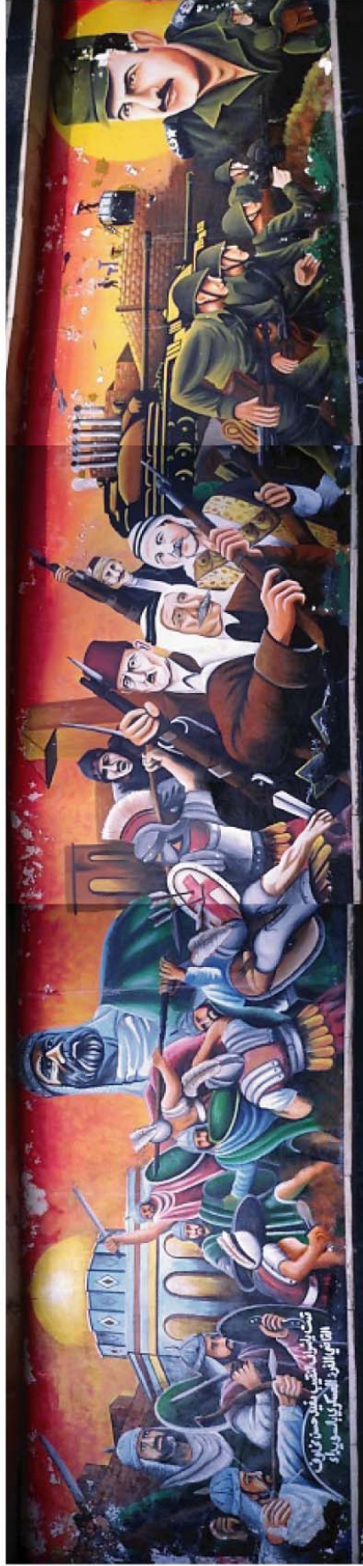
(Clichés : Roussel C., 2001)