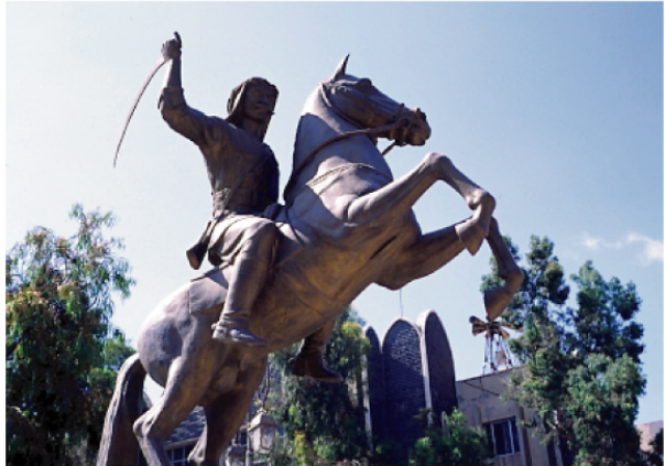
Vue n° 2 : la statue de Sultan édifée dans les années 1950 (Sweida)