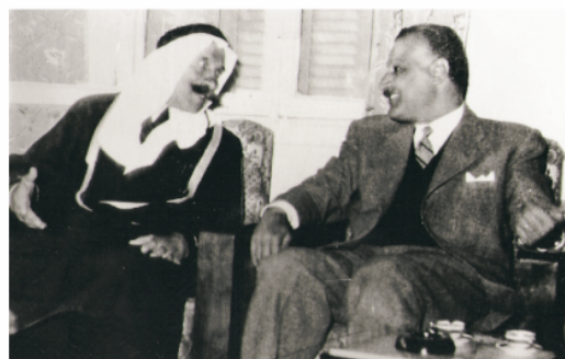
Vue n° 3 : la visite du président égyptien, Kamel Abdel Nasser à Sweida en 1960