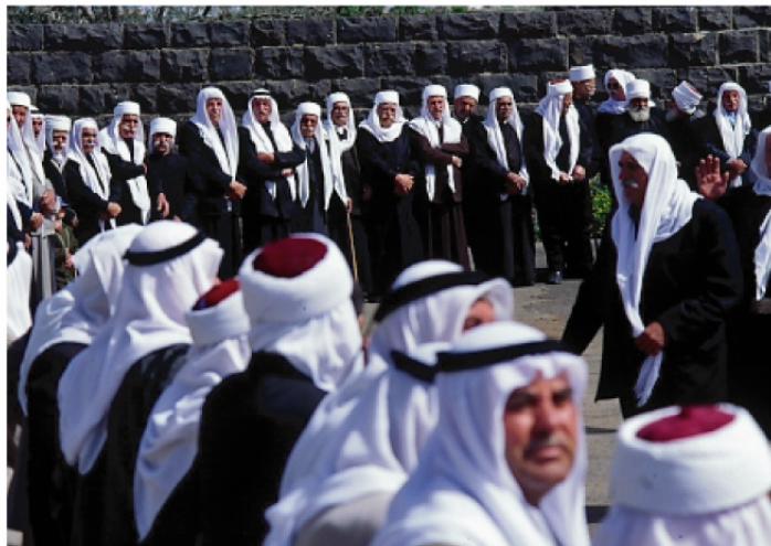
Vue n° 1 : arrivée des notables druzes à Al-Qrayya