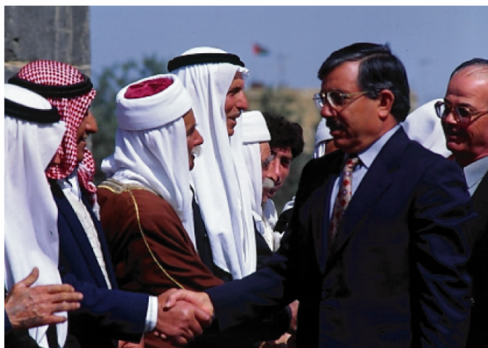
Vue n° 3 : visite des représentants du gouvernement aux notables druzes