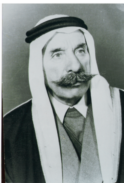
Vue n° 2 : portrait de Sultan el-Attrach