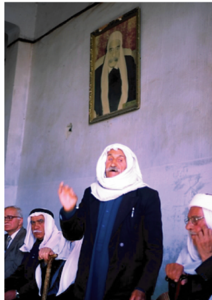
Vue n° 6 : discours d'un notable druze sous le portrait de Sultan (Al-Qrayya)