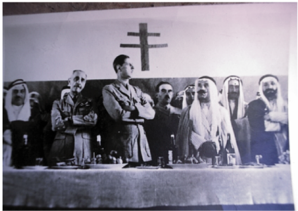
Vue n° 4 : Sultan et le Général De Gaulle (années 1940)