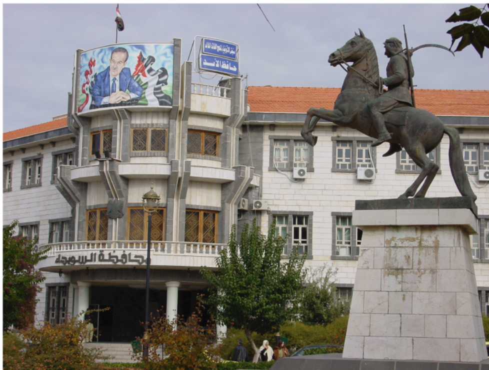
Planche photographique n° 2 : Sultan el-Attrach, une envergure politique nationale