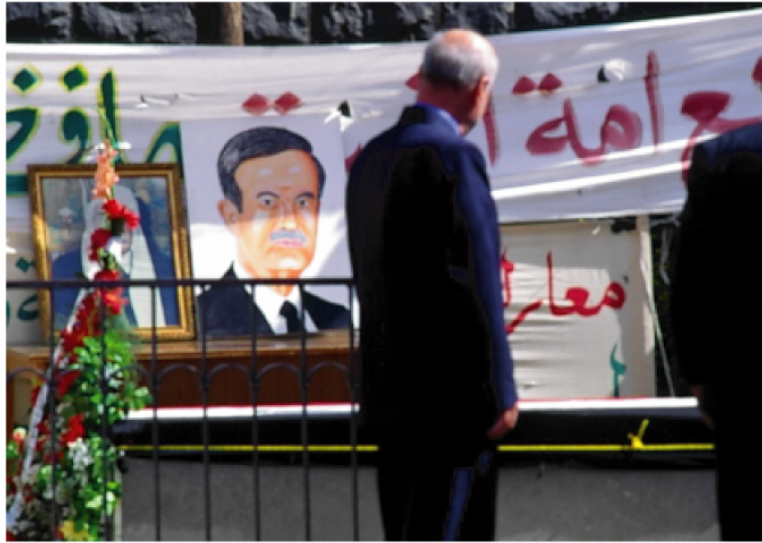
Vue n° 1 : portraits de Hafez el-Assad et de Sultan el-Attrach sur la tombe de Sultan