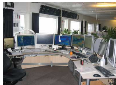
Figure 1. Poste de travail d'un opérateur dans un VTS.

Les VTS (Vessel Traffic Service) sont les centres de contrôle à partir desquels le trafic maritime est surveillé. Ils ont pour but d'améliorer la sécurité et l'organisation du trafic ainsi que de protéger l'environnement.