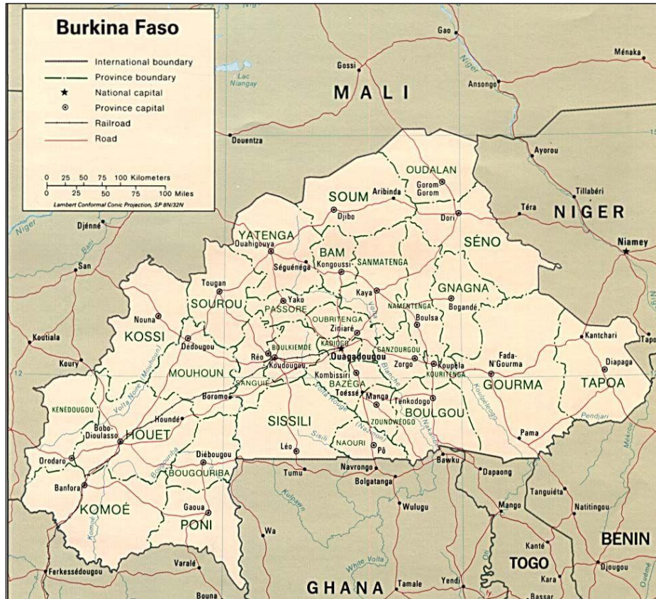
Carte 1 : Burkina Faso politique 1996