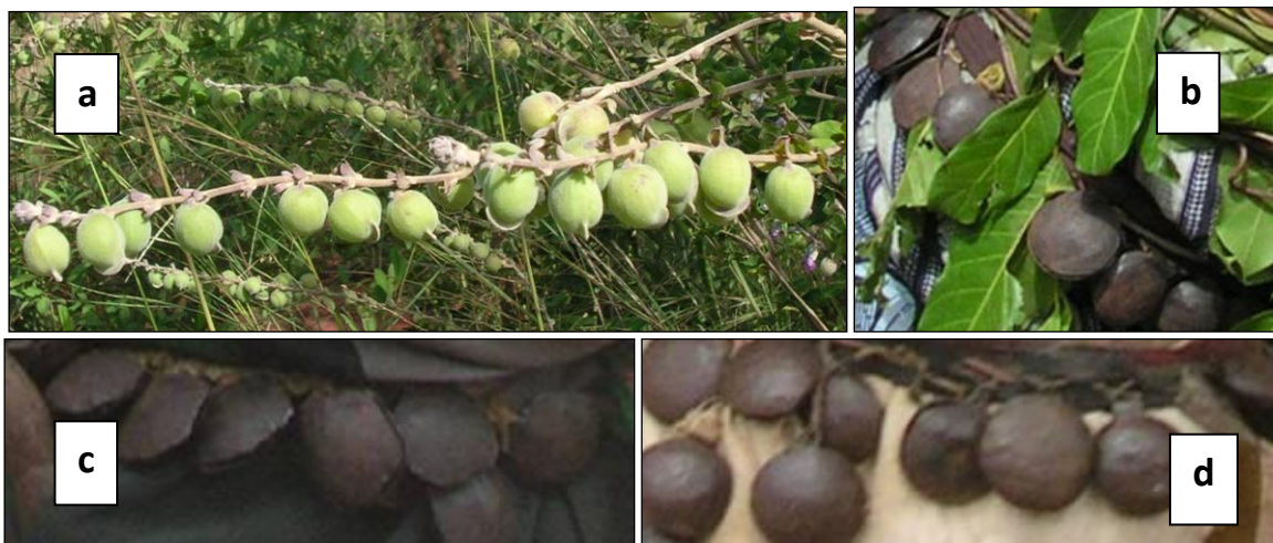
Figure 1. L’espèce Tinnea barteri et les grelots des danseurs :

Si on n’avait que ce type de composé, on serait tenté de dire qu’en l’absence de terme simple, la dénomination des plantes dépendra soit de l’emploi auquel elles sont destinées, soit d’un aspect formel par lequel elles ressemblent à un autre objet. Malheureusement, on ne pourra pas faire rentrer tous les composés dans ces catégories sémantiques, du moins pas sans enquête approfondie. Considérons par exemple l’espèce Tinnea barteri Gürke (Figure 1) de la famille des Lamiaceae, bāárñ-gbōngbāl , qui a des fruits qui ressemblent aux grelots portés par certains danseurs lors de fêtes traditionnelles (Fig. 1) : ce nom signifie littéralement “grelot de lièvre”. Si le rapport formel avec le grelot est manifeste, nous ne pouvons pas savoir a priori pourquoi cet objet doit appartenir au lièvre.