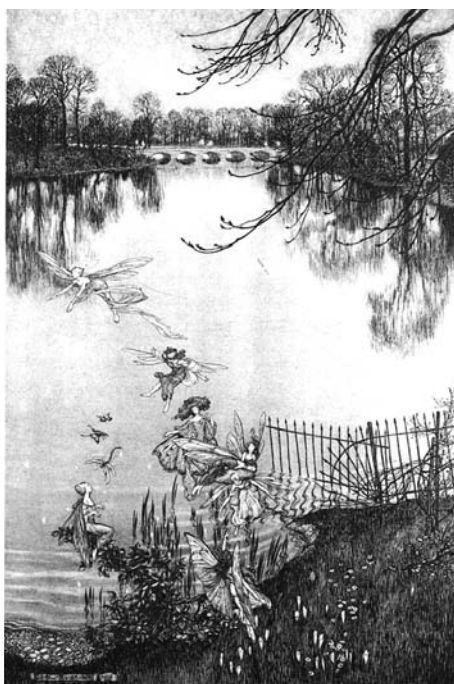
Fig. 2 : « C'est une rivière charmante, et il y a une forêt engloutie au fond... »