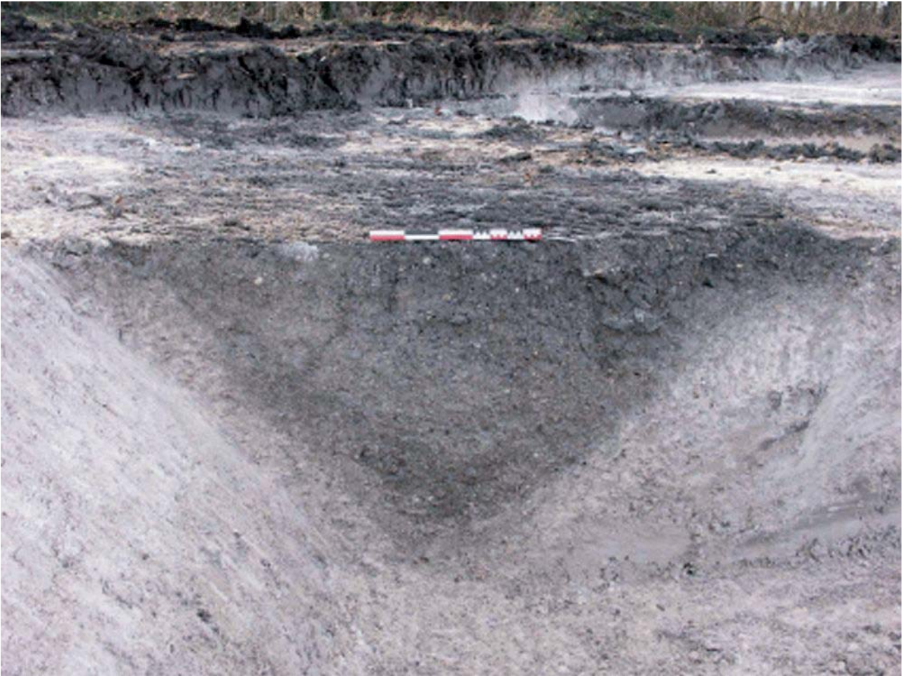
Document 2. Vue d'une section de l'enclos de l'exploitation agricole de la fin de l'âge du Fer.