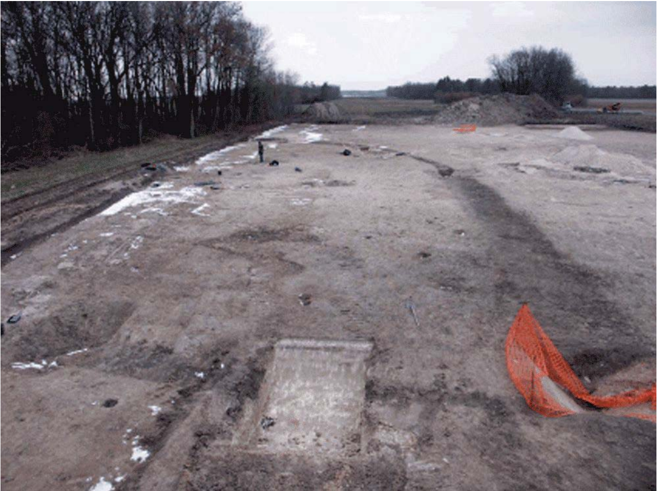
Document 1. Vue du décapage avant la fouille.