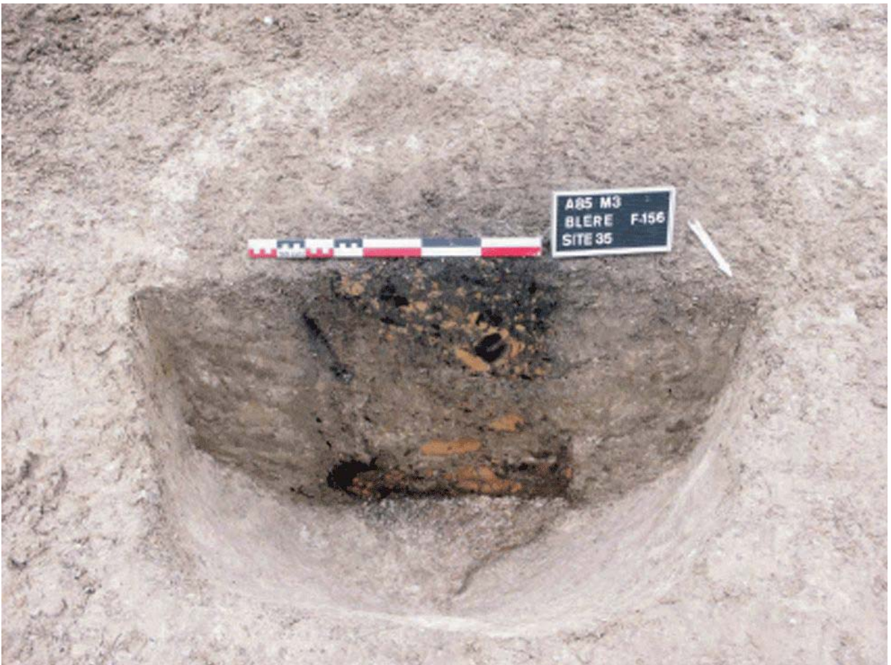
Document 4. Coupe d'un trou de poteau avec, au centre, la trace du poteau.