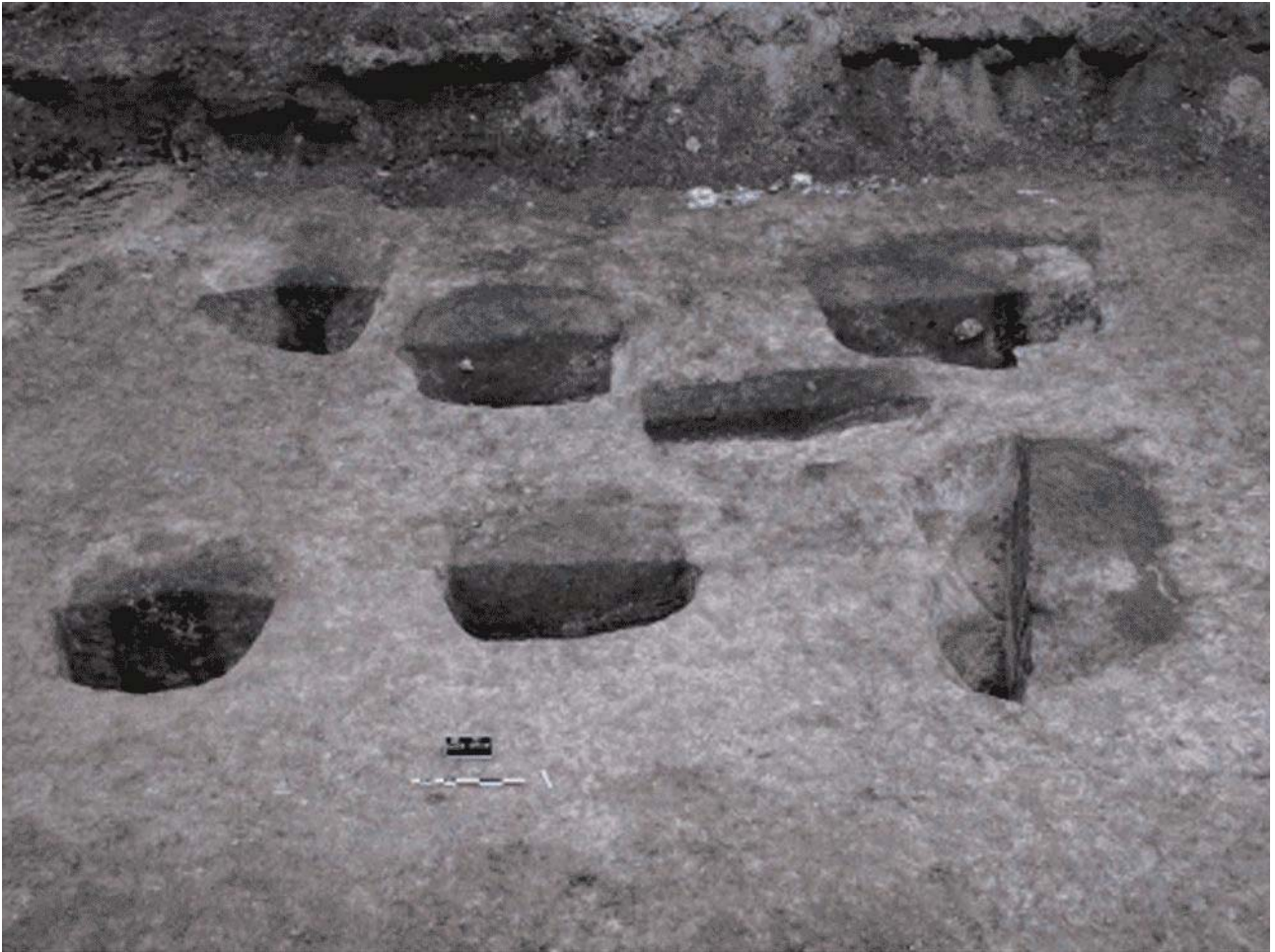
Document 5. Trous de poteau de deux constructions successives de l'âge du Fer.