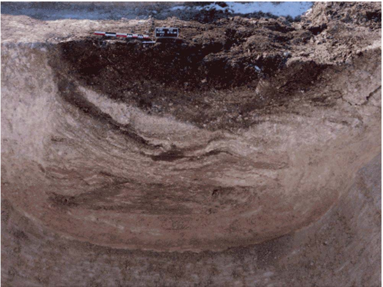
Document 3. Coupe du comblement d'un silo.