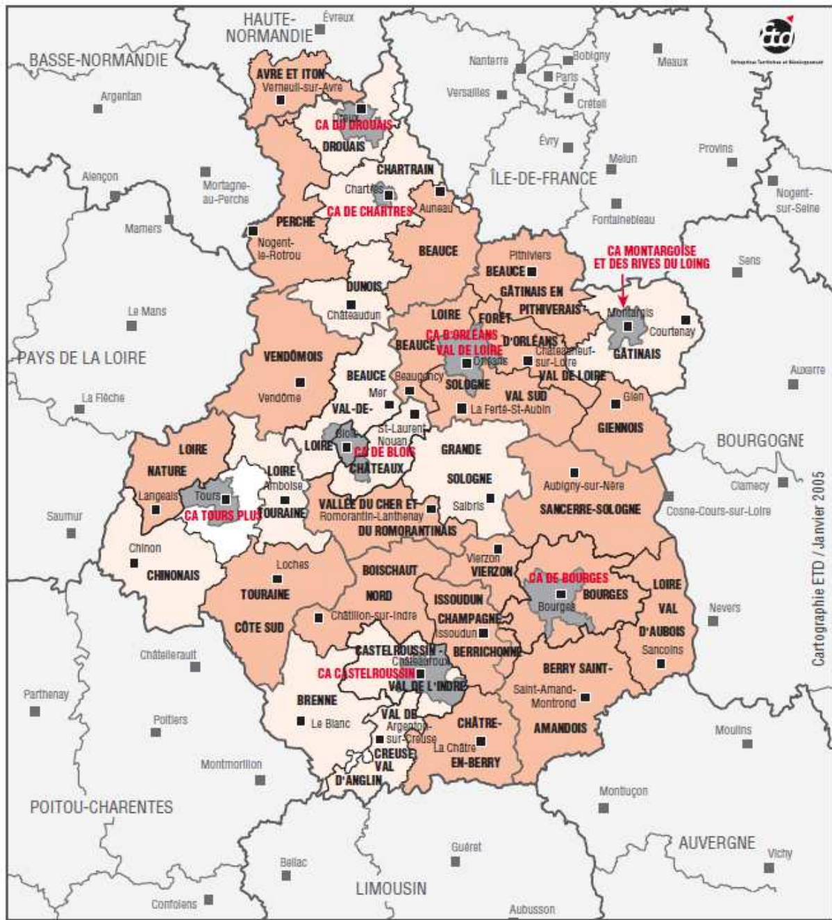
Carte 1.– Pays et agglomérations en région Centre