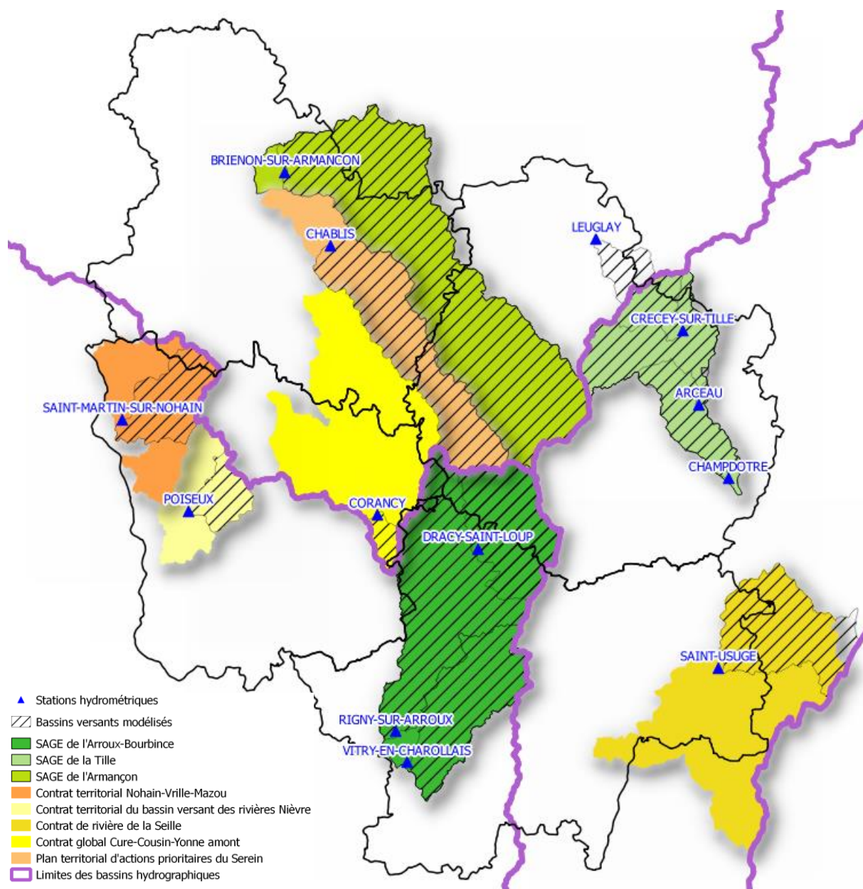
Figure 2 : Carte des bassins versants étudiés dans le cadre d'HYCCARE (Alterre, 2015)