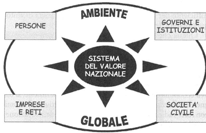
Figura 2. La filiera del valore a livello globale.

zione, che ne nasce è un modello nazionale di produzione del valore economico e sociale che riflette la cultura o le culture presenti nel Paese nonché la loro dialettica ed è anch'esso assolutamente unico.