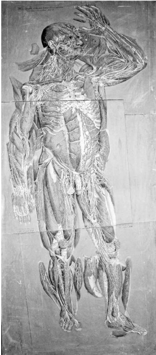
Paolo Mascagni, Anatomiae Universae Icones, Corporis umani facie adversa stratum secundum, tav. I, II, III

fisiologica o patologica rendessero necessario un ampliamento del museo che lo stesso arciduca Francesco IV approvò dopo averlo visitato. Tra il 1839 e il 1840 vennero realizzate due sale simmetriche,