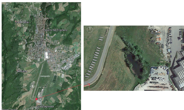
Fig. 3 – Ubicazione della zona umida

La pianta è stata localizzata nel maggio 2014 in un piccolo stagno nel comune di Pavullo nel Frignano (Lat. 44°18'53.77" N, Long. 10°49'49.33" E) in un'area limitrofa all'aeroporto (Fig. 3). Utricularia è qui presente con una popolazione abbondante che si può osservare per gran parte del perimetro del bacino, soprattutto a NNE, dove il livello dell'acqua risulta più basso. È associata a elofite quali Typha latifolia , Alisma plantago , Lythrum salicaria e da quest'anno alcune piante sono state individuate anche nel piccolo fosso di drenaggio, anch'esso ricco di vegetazione palustre. La restante parte del perimetro è caratterizzata dalla presenza di Phragmites australis e di piante arboree quali pioppi e salici, alcuni di grandi dimensioni morti al centro dello stagno (Fig. 4), oltre ad alberi da frutto rinselvaticiti.