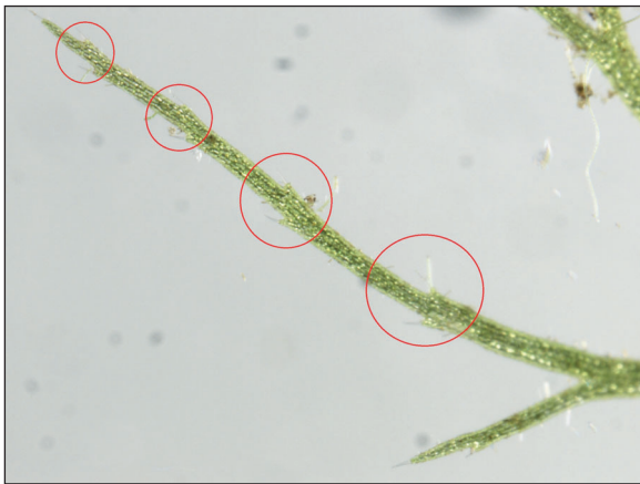
Fig. 5 - Segmenti fogliari terminali con denti muniti di setola

È oggi in corso un tentativo di coltivazione in serra con l'intento di indurre la fioritura della pianta in modo da poterne accertare l'attribuzione specifica sulla base delle caratteristiche fiorali.