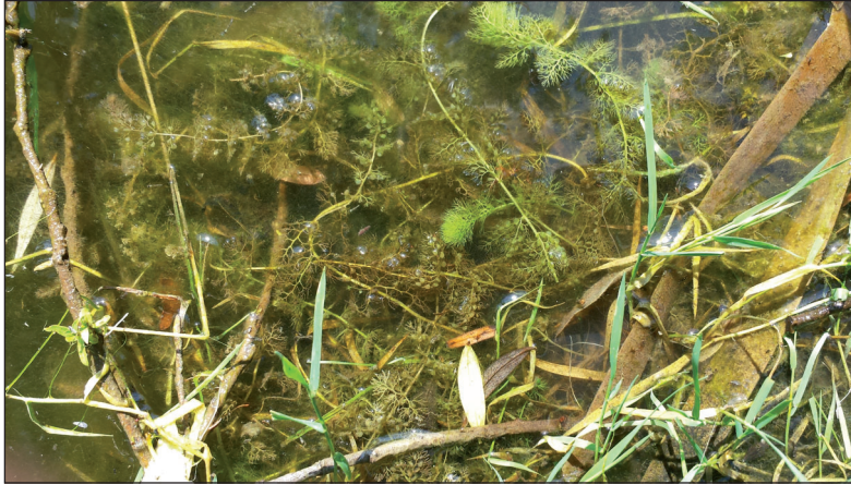
Fig. 1 – Piante di Utricularia sp. nello stagno di Pavullo nel Frignano (MO)