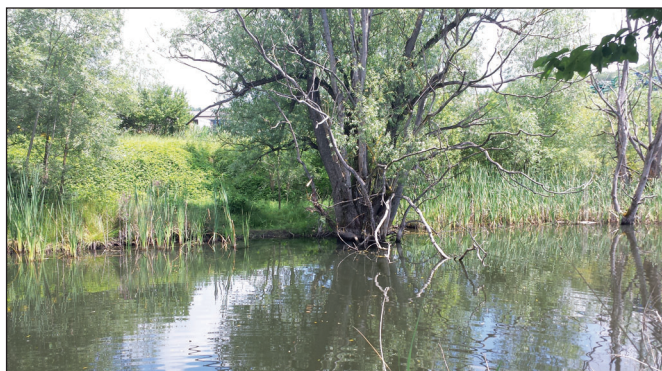
Fig. 4 – Stagno di Pavullo nel Frignano dove si trova la popolazione di Utricularia sp.