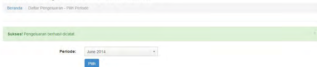
Gambar 2. Pemberitahuan Pencatatan Pengeluaran Berhasil Dilakukan