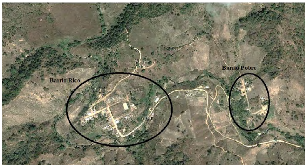
Figura 2. Estructura de la localidad de Los Laureles en la REBISE. Muestra los dos asentamientos conocidos como Barrio Rico a la izquierda y Barrio Pobre a la derecha.