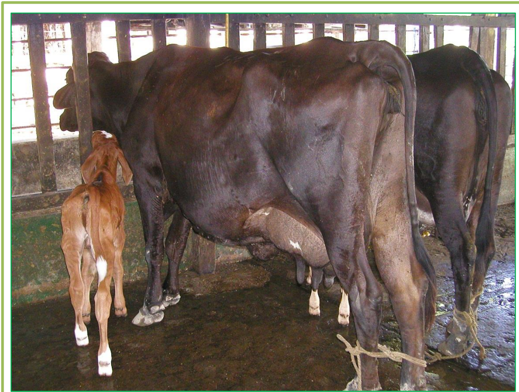
Figura 3. En la vereda Matepiña se encontró un 54.6% de prevalencia de mastitis subclínica.

lavados antes y después del ordeño generalmente con agua jabón y cloro, manteniéndolos en lugares limpios.