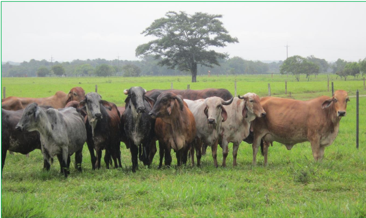
Figura 1. La vereda Matepiña está conformada por 10 fincas que se dedican a la producción de leche, cría y levante de ganado.

2.810 cabezas (mestizo-puro), de los cuales 1.980 son machos y 830 son hembras (ICA, 2008). Cada finca cuenta con corral de ordeño y con personal para estas labores, que varía en 3 y 4 personas por finca, quienes se encargan en las horas de la tarde del día anterior, de separar las crías de las madres en 2 corrales diferentes, y en la mañana en la jornada de ordeño, después de restringir a las madres, permiten que las crías se alimenten un poco, estimulando las glándulas mamarias y posteriormente proceden a realizar el ordeño, que para todas las fincas se realiza de forma manual, luego las crías se llevan con sus madres, a un corral de pastoreo y suplementación con sal mineralizada, pasto de corte, maíz y residuos de cultivos de plátano (esta actividad es igual para todas las fincas).