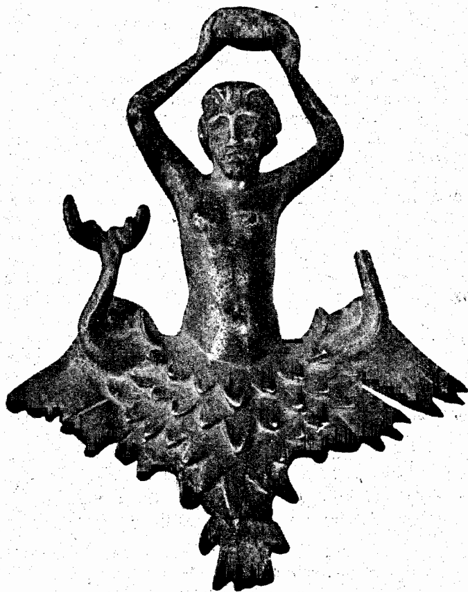
Fig. 1 — Bronze representando uma Nereida, encontrado em Alvarinhos (Santo Tirso)