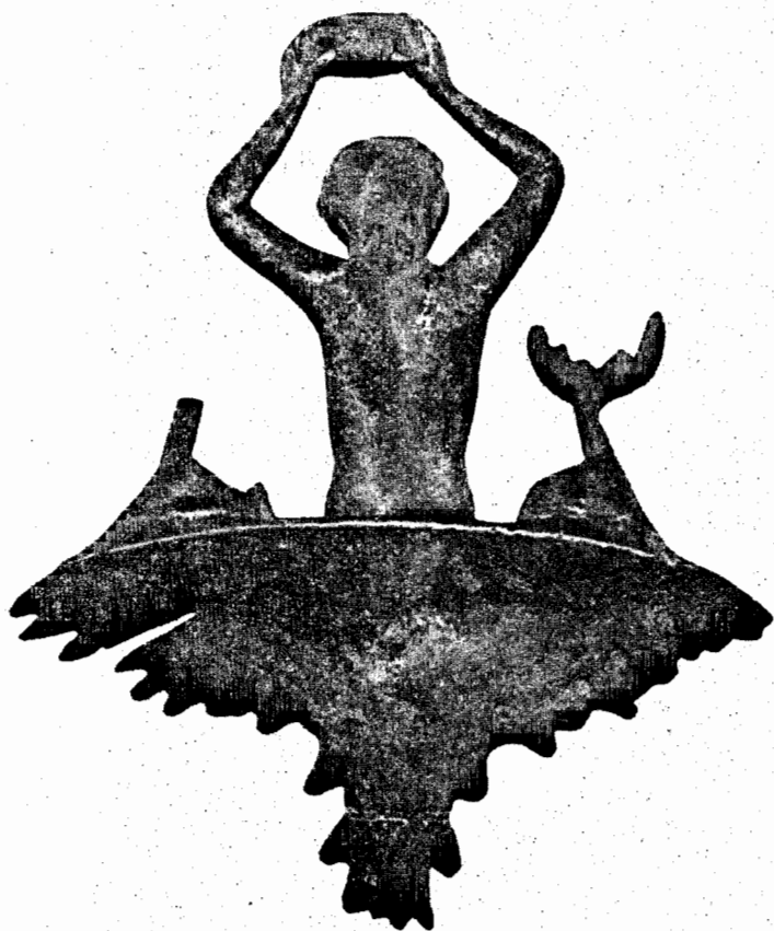
Fig. 2— O mesmo bronze visto pela parte posterior