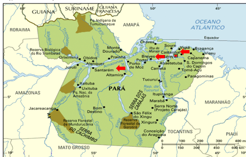
Figura 2 – Mapa do Estado do Pará

Cada projeto tem duração de seis meses, a jornada inclui workshops presenciais, mentorias individualizadas, acompanhamento dos negócios, webinars temáticos, bolsas de estudo e apoio logístico para participação em eventos ou cursos, assessoria contábil, jurídica e de marca. Ademais, participam de rodadas de negócios ao estilo shark tank , que reúnem investidores de impacto, institutos e fundações filantrópicas e os negócios selecionados para participar das jornadas de aceleração (a inovação no modelo de financiamento, ao trazer, com um mecanismo chamado Blended Finance - em português, financiamento híbrido) (IDESAM, 2020).