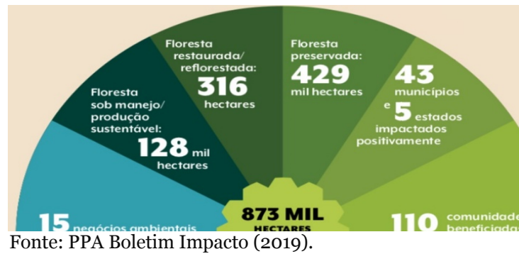
Figura 3 – Impacto Socioambiental do PPA 2019

Acerca do Impacto Socioambiental positivo mensurado nos negócios sustentáveis da edição PPA 2019/ 2020 podemos observar na Figura 03, que: foram 15 negócios ambientais contemplados, 110 comunidades com o alcance de 873 mil hectares, divididos em: floresta sob manejo/ produção sustentáveis, floresta restaurada/ reflorestada, floresta preservada abrangendo 43 municípios em 5 estados da federação.