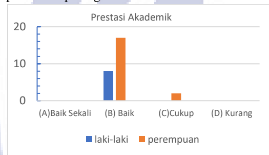
Gambar 2. Prestasi akademik responden

Apabila ditampilkan dalam bentuk diagram dapat dilihat pada gambar dibawah ini: