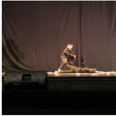
Gambar 9 : gerakan kayang