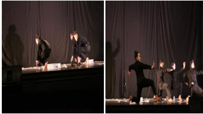
Gambar 11&12 : gerak saling sinambungan (tetapi gerakan ini dilakukan secara serempak.