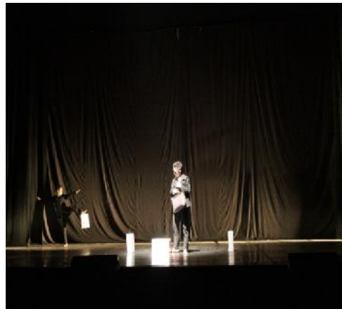
Gambar . 2

Ragam gerak singgungan memiliki nilai estetis di bagian tangan dan kaki yang memang menggambarkan seorang pejabat yang angkuh dan sombong dalam memperlihatkan jabatannya. Dalam ragam ini didesain sangat pelan sekali, hal ini koreografer buat supaya kuat dan berkesan berkuasa. Pada ragam ini memiliki kekuatan pada bagian transisi dimana pada ragam ini menghubungkan dengan ragam selanjutnya. Keunikannya terletak pada perbedaan kekuatan dan motif gerak pada penari.