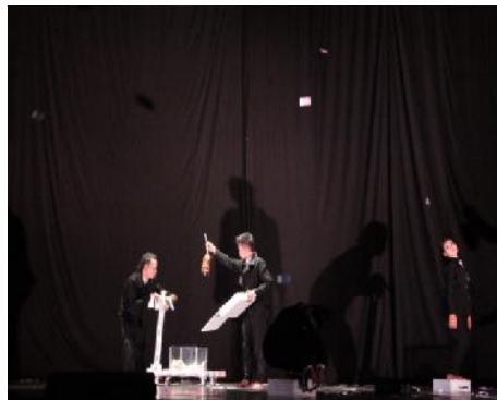
Gambar !3 : akhir (Ending) dan suasana pada karya tari

Ending pada karya tari ini memang tidak banyak memerlukan gerakan yang terlalu padat, tetapi hanya fokus pada bagian center panggung. Pada center panggung merupakan transisi kebagian klimaks agar menjadi satu tonjolan yang mengangkat suasana klimaks.