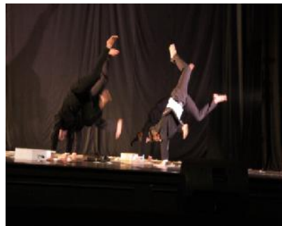
Gambar 10 : gerakan meloncat kepala terbalik

Ragam gerak meloncat kepala terbalik melakukan gerak representatif penari yang didepan dan gerakan membentuk hewan yang memerlukan penonjolan dibagian kekuatan penari dalam menonjolkan sebuah karakter hewan tikus sesuai dengan teori prinsip bentuk seni yaitu variasi.