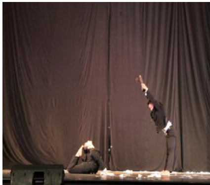
Gambar 8 : gerak kalajengking

Ragam gerak kalajengking memiliki keunikan dengan kaki ditebuk bentuknya poin dan kaki lurus ke atas. Gerak ini tidak boleh lemah tetapi kuat di kaki dan kepala.