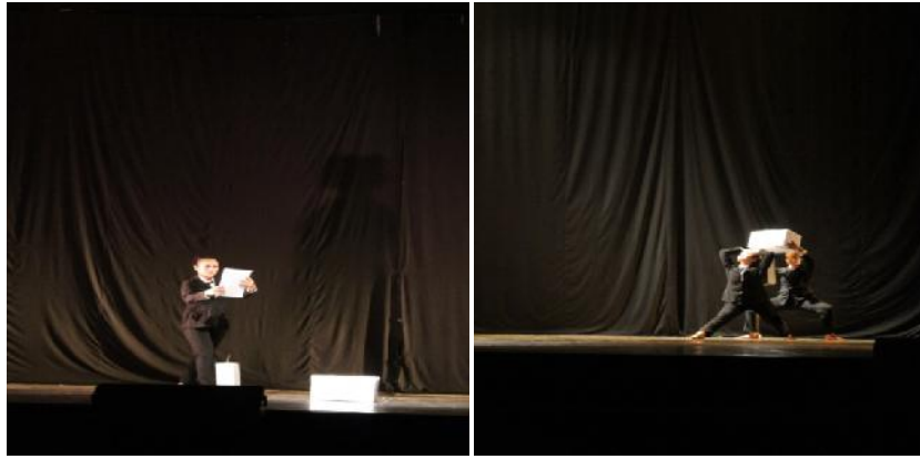
Gambar. 3 dan 4 : Ragam baca buku dan bawa kardus