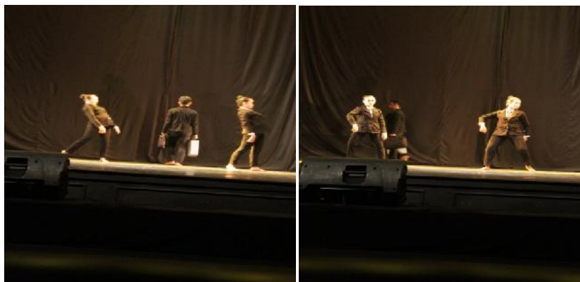
Gambar 5&6 : gerak serempak yang dilakukan penari putri

Ragam gerak serempak adalah gerakan tubuh yang membentuk gerak terombang-ambing dan meliuk-liuk dengan pusat gerak di torso bagian pinggang, gerakan ini dilakukan secara serempak. Nilai keindahan yang ingin disampaikan koreografer adalah gerak meliuk-liuk ini.