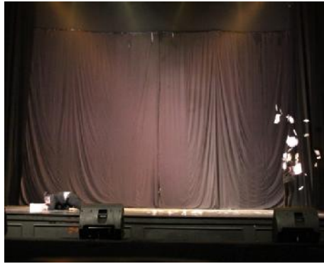
Gambar 7 : gerak mendorong kardus dengan kepala