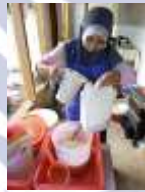
10. mengukur glasiir dengan tabung ukur

Berikut langkah sederhana untuk mempersiapkan glasiir yang akan digunakan. Cairan glasiir yang sudah siap ditimbang dan diukur untuk pengglasiran mawar-mawar merah. Dengan memperkitrakan kebutuhan, memerlukan 1 kg glasiir dan 7% pewarna merah, yaitu 70 gram bubuk pewarna merah. Kemudian bubuk pewarna merah yang sudah ditimbang dimasukkan ke dalam cairan glasiir. Diaduk dan siap digunakan.