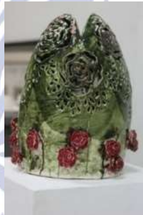
Gambar 4.24 karya berjudul “Unity” “Unity”