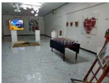
Gambar Pameran berlangsung di gedung T3 seni rupa, ruang studio lukis Unesa

pengujian atau verifikasi dilakukan dengan cara pameran karya di gedung T3 Seni Rupa Unesa. Pameran menggunakan postek, sebagian di sajikan dengan instalasi dan hiasan dinding. Repetisi bunga mawar di sajikan dengan gelas yang elegan.