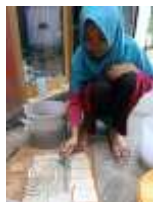
13. Proses pengglasiran dengan kuas

Caranya cairan glasiir yang sudah siap dapat disiramkan, atau benda keramik dicelupkan kedalam cairan glasiir, setelah beberapa detik akan mengering dan siap dibakar suhu tinggi.