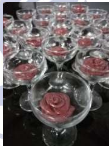
“Glamour of Rose”