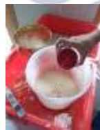
12. Menambahkan pewarna kedalam cairan glasiir 7% dari cairan glasiir

Caranya cairan glasiir yang sudah siap dapat disiramkan, atau benda keramik dicelupkan kedalam cairan glasiir, setelah beberapa detik akan mengering dan siap dibakar suhu tinggi.