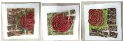
Gambar 4.23 karya berjudul “3 mawar” “3 mawar”