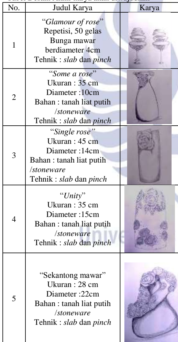
Tabel Desain Akhir karya akan diwujudkan