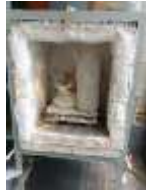
9. Tungku yang digunakan untuk pembakaran suhu tinggi

Pembakaran kedua adalah pembakaran tinggi atau bersuhu tinggi, berkisar 1150 0 Celcius dan seterusnya. Pembakaran bahan stoneware, porselen, dan bonechina (keramik putih tulang) adalah dalam kategori pembakaran suhu tinggi.