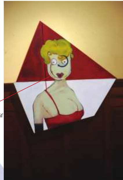
Karya #11, 110x118 cm acrylic pada kanvas tahun 2012