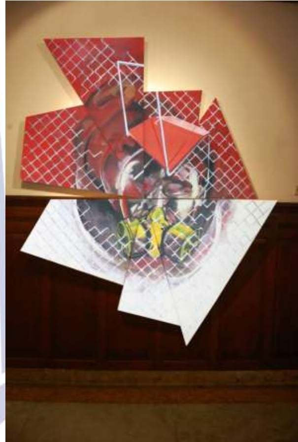
judul #1, 203,5x250 cm, acrylik di kanvas tahun 2012