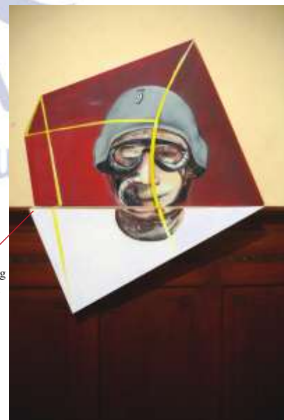
Karya #3, 92x104 cm acrylic pada kanvas tahun 2012

Merespon ruang pamer dengan media kanvas yang atraktif.