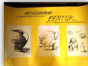
Gambar 2. Media Untuk Menggambar Bentuk

Ketika guru melakukan penjelasan dengan media visual tentang materi menggambar bentuk, diselingi juga dengan tanya jawab kepada siswa. Hal ini dilakukan untuk meninjau pemahaman siswa setelah menerima materi yang disampaikan guru. Guru juga membuka pertanyaan untuk siswa, hal ini dilakukan agar siswa yang belum memahami materi dapat menanyakan kepada guru.