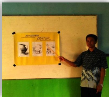
Gambar 4. Guru Dalam Penyampaian Materi Gambar Bentuk Di kelas

Kemampuan guru dalam memanfaatkan media juga terbilang cukup baik yakni, selain guru menggunakan media sebagai alat bantu pengajaran, guru juga menggunakan metode pembelajaran dengan ceramah, dimana didalam penyampaian materi tersebut guru seni budaya tersebut dapat menguasai arah pembicaraan selama jam pelajaran di kelas, serta pada saat menyampaikan materi pembelajaran pada mata pelajaran seni grafis guru dapat menentukan sendiri arah pembicaraan.