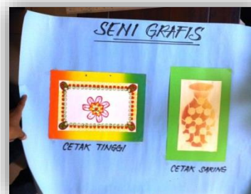
Gambar 3. Media Seni Grafis

Dalam proses pembelajaran di kelas, guru tersebut lebih mengutamakan pembelajaran klasikal seperti metode ceramah, serta metode karya cipta bebas dengan tidak memanfaatkan media elektronik sebagai penunjang pembelajaran di kelas dan hanya menggunakan media visual sebagai alat peraga yaitu lembaran kertas hasil karya guru yang ditempelkan.