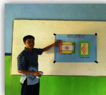
Gambar 5. Guru Dalam Penyampaian Materi Seni Grafis Di kelas

Dalam pemanfaatan media pembelajaran seni grafis yaitu adanya alat peraga yang dimiliki guru yakni memanfaatkan hasil karya guru yang ditempelkan di kertas, lembaran tersebut berupa contoh teknik cetak tinggi dan teknik cetak saring yang kemudian digunakan guru dalam menyampaikan materi pembelajaran di depan kelas dengan cara menempelkannya pada papan tulis.