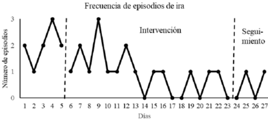
Figura 3 Evolución de la Intensidad de Episodios de Ira Significativos de J a lo Largo del Estudio