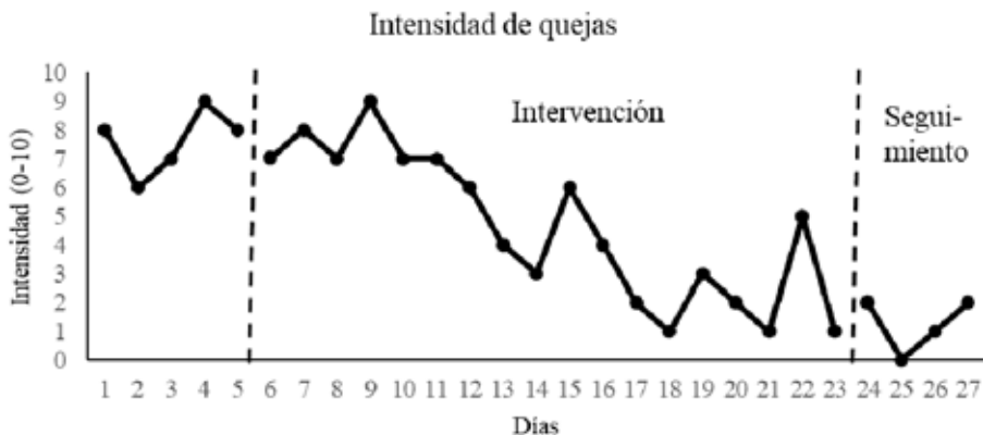
Figura 4 Evolución del Nivel de Quejas de J a lo Largo del Estudio