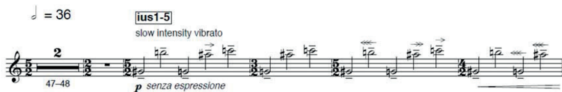
FIGURA 3. FRAGMENTO DE LA VOZ DEL SAXOFÓN SOPRANO DEL CUARTETO 2 DE IUS CHASMA

En el caso de la interpretación en el Guggenheim, esta pieza divide los saxofones en tres cuartetos que se sitúan en distintas zonas del atrio. Lo interesante, aquí, es la atención al pequeño desfase que se genera por la reverberación del atrio, abierto y con techos muy altos: es decir, se tiene en cuenta, en un sentido pleno, la conciencia espacial. El desfase se trabajó no solo en términos estrictamente acústicos, sino también armónicos: la pieza es microtonal (la escala está dividida, en concreto, en 36 semitonos) y cada cuarteto tenía su propia afinación a distancia de sexto de tono (440 Hz, 448,55Hz, 431,61Hz) 52 : el hipersaxofón se convertía, así, en una hiperescala. Parte de la escritura de esta pieza 53 , con notación ortocrónica pero con algunas indicaciones de nuevas grafías (en este caso, la flecha superior a las notas que, según su grosor, invita a desplazar más o menos la nota del tiempo en el que debería sonar), implica un desplazamiento irregular del tiempo, lo que busca «conseguir», en términos del autor, es «una sutil granulación del tiempo» (FIGURA 3). Es decir, se intenta conseguir un tiempo fluido y modificado por el intérprete para que tenga margen de acción con respecto al desfase sonoro.