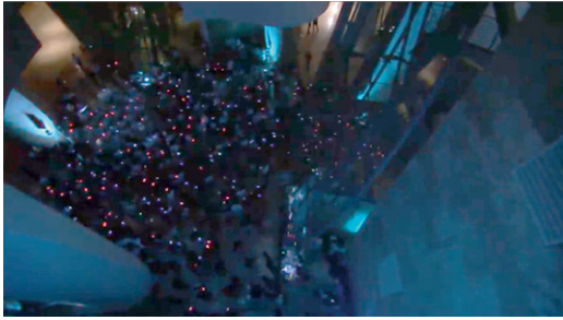
FIGURA 4. FMGB, «CHASMATA». https://www.youtube.com/watch?v=bACHXWfe1Ao Vídeo del streaming del 9 de octubre de 2017 [Consultado el 25 de abril de 2022]

intervención en las piezas –por más que sea de una forma muy pautada–. Algunas de sus aplicaciones tienen un fin principalmente pedagógico, pensado para no iniciados en la creación contemporánea. Es el caso de SoundCool, un proyecto de la Universidad Politécnica de Valencia que ha sido utilizado en varias propuestas, como X Ensems 2018. En otros casos, como el que nos ocupa, se insta al público (y al resto de intérpretes) a que co-cree parte de la pieza en vivo. Para ello, debían descargarse la aplicación también