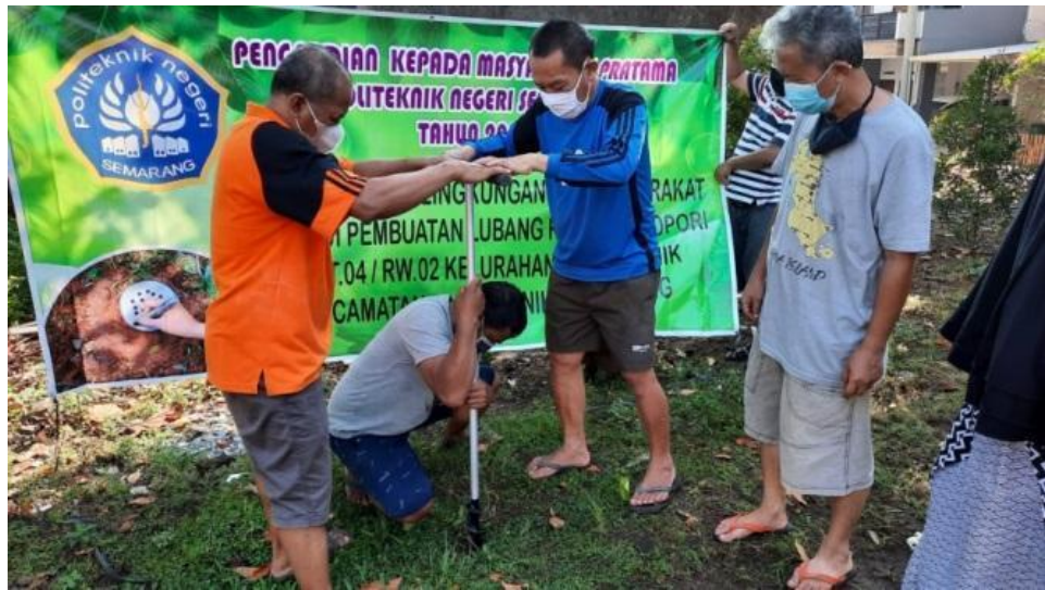
Gambar 5. Praktek pembuatan lubang biopori