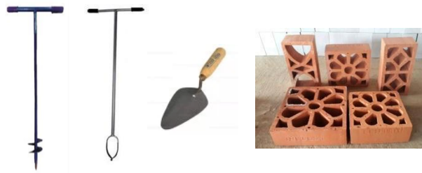
Gambar 2. Alat dan Bahan untuk pembuatan Lubang Resapan Biopori

Dalam fungsinya, Lubang Resapan Biopori berperan sebagai pintu masuk air hujan yang jatuh ke permukaan bumi. Sampah organik atau yang mudah membusuk sisa rumah tangga cukup dimasukkan ke dalam lubang silindris yang dibuat secara vertikal ini. Kedalaman lubang berkisar 80-100 cm dengan lebar antara 10 hingga 30 cm. Tujuannya, untuk “mengaktifkan” lubang biopori. Sampah akan menjadi sumber energi bagi organisme tanah, seperti cacing untuk melakukan kegiatannya melalui proses dekomposisi. Sampah yang telah