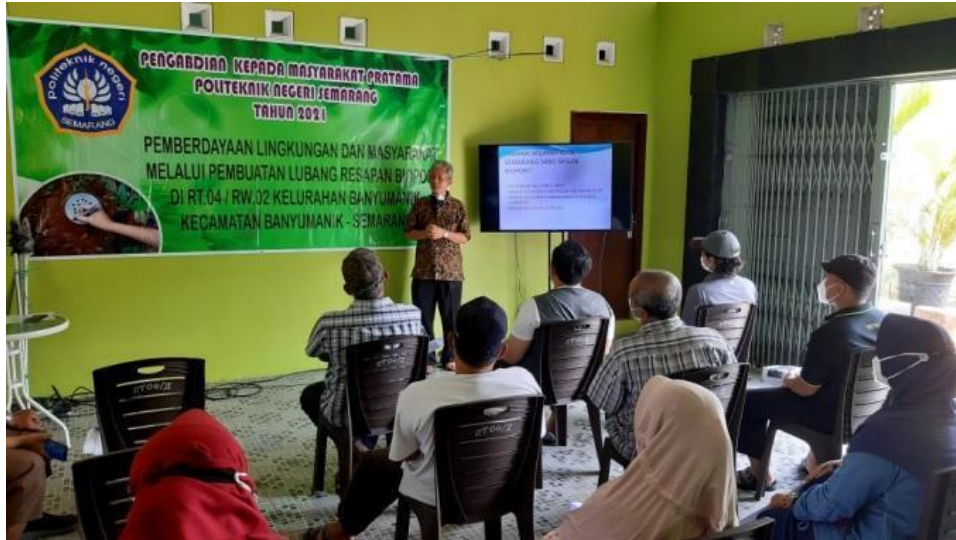
Gambar 4. Penyuluhan pembuatan lubang biopori kepada warga RT.04/RW.02 Kel. Banyumanik

Dengan adanya program pengabdian kepada masyarakat ini merupakan peran dosen untuk implementasi program Tri Dharma Perguruan Tinggi dari Politeknik Negeri Semarang. Kegiatan tersebut diharapkan dapat memberikan manfaat langsung berupa terhindar adanya genangan air, mengurangi terjadinya banjir, menyuburkan tanah, terhindar adanya kekeringan karena terjadi resapan air di sekitar biopori, meningkatkan pendapatan bagi masyarakat, menciptakan lingkungan yang