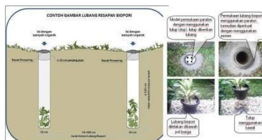
Gambar 1. Lubang Resapan Biopori

Selain untuk meresapkan air keuntungan lain dari pembuatan biopori ini adalah bisa diproduksinya kompos yang apabila ini dikelola dengan baik tentu akan mempunyai nilai ekonomis. Kompos ini bisa dimanfaatkan masyarakat untuk memupuk tanamannya sendiri atau kalau bisa dikelola dengan baik bisa dijual untuk menambah penghasilan masyarakat.