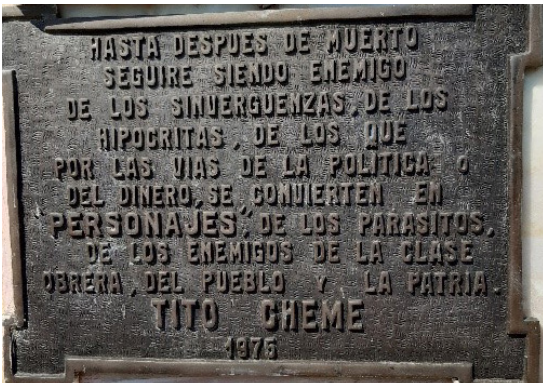
Imagen 6. Placa de Tito Cheme, cementerio de Empedrado.