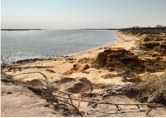
Imagen 4. Barrancas de Empedrado, Corrientes.