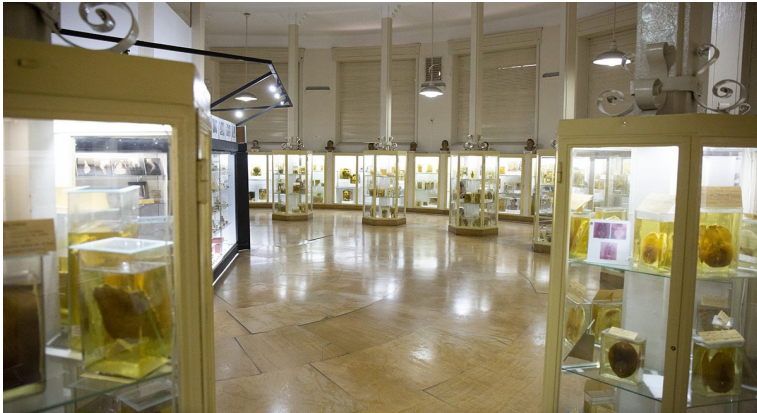
Imagen 1. Museo de la Morgue Judicial.

Luego de recorrer varias veces la sala, y ya superada la impresión y fascinación inicial que generaba la muestra, comencé a mirar unos bustos –cuyos rostros eran máscaras mortuorias– acomodados arriba de los aparadores. Cada uno de ellos tenía también una ficha en las que figuraban datos tales como el año de muerte, la nacionalidad y el oficio, pero no la identidad del muerto. En todos los casos se trataba de hombres, con bigotes en su amplia mayoría, que respondían al estereotipo del inmigrante europeo que arribó a la Argentina a fines del siglo XIX y principios del siglo XX.