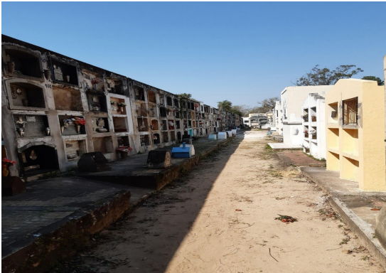
Imagen 5. Cementerio de Empedrado.