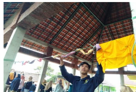
Gambar 6. Proses penjemuran diangin anginkan

Langkah selanjutnya adalah penjemuran, yang dilakukan proses angin-angin tidak menjemur langsung dibawah sinar matahari.