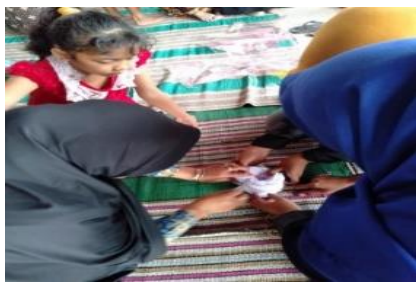
Gambar 4. Pembuatan pola untuk kain jumput