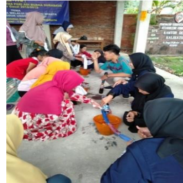
Gambar 5. Teknik celup pada proses pembuatan batik jumput

di lakukan pencucian dengan detergen untuk menjaga warna pada kain. Setelah kain kering, batik siap dipakai.