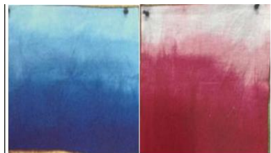
Gambar 2. Teknik Ombre (Mahendra, 2016)

2. Teknik Ombre Teknik menghias kain yang memanfaatkan lama dan cepatnya waktu pewarnaan dengan cara pencelupan dan (rembesan) warna ke dalam pewarna. Teknik ini akan menghasilkan gradasi warna pada kain batiknya.