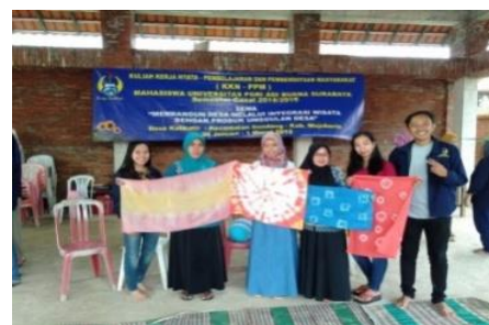
Gambar 7. Hasil pelatihan batik jumputan

Ini lah di hasil dari pembuatan batik jumput yang dilakukan oleh warga desa dan program pengabdian masyarakat sendiri dirumah untuk di jadikan usaha warga sendiri