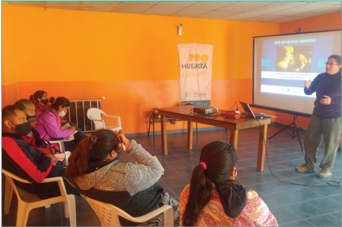
Figura 2: Capacitaciones recibidas por productores familiares, previo a la entrega de pavitos bebé.

El sistema de cría propuesto es de tipo intensivo, donde los PVBB se receptionan con 2 días de vida y se debe mantener un ambiente favorable en su etapa de cría (Mes 1), regulando la temperatura de la cama en 34 °C y reduciendo 3 °C cada 3 días.