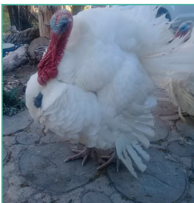
Pavos en etapa de crecimiento (izquierda) y pavo macho en etapa de engorde (derecha).