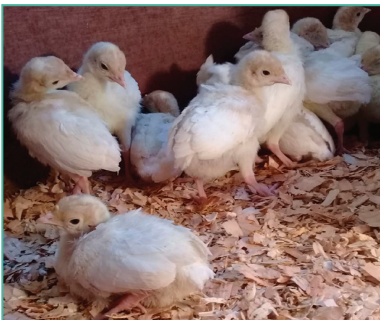
Figura 1: Recepción de pavitos bebé desde Centro de Multiplicación Pergamino.

La demanda por la cría de pavos híbridos se reanudó durante el 2020 con una primera entrega de animales provenientes del centro de multiplicación de INTA Pergamino. En la primavera de ese año se distribuyeron 137 pavitos bebé (PVBB) (Figura 1) que fueron destinados a 9 productores familiares. Con los resultados de esta experiencia, en 2021 se comercializaron 99 PVBB en 16 granjas familiares. El impacto negativo del primer año, reflejado por una mortandad del 42 %, hizo repensar la estrategia de distribución, planteando una reducción en el número de animales y un incremento de las granjas.