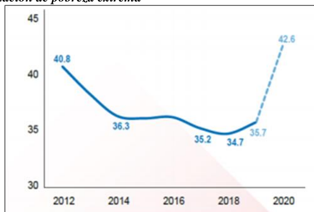
Gráfica 2. Personas en situación de pobreza extrema