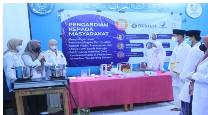
Gambar 4. Praktek pembuatan sabun padat trasnparan

Minyak inti sawit dan asam stearate dilebur menggunakan cawan penguap pada suhu 60^{\circ}\text{C} diatas pemanas air. Tuangkan minyak inti sawit dan asam stearat yang telah dilebur ke dalam beaker glass diatas pemanas 70\text{-}80^{\circ}\text{C} . Kemudian diaduk menggunakan stirrer dengan sampai homogen. Tambahkan larutan NaOH 30% yang telah dipanaskan sedikit demi sedikit aduk selama 15 menit sampai terbentuk massa yang kental sehingga menghasilkan massa sabun. Tambahkan etanol 96% pada suhu 60^{\circ}\text{C} , diaduk selama 5 menit. Tambahkan gliserin ke dalam campuran, kemudian tambahkan sukrosa yang telah dilarutkan dengan aquadest ditambahkan, diaduk selama 5 menit. Tambahkan Asam Sitrat, NaCL dan Kokoamide DEA aduk selama 5 menit. Tambahkan pewarna dan pewangi, diaduk sampai homogen. Campuran dituang ke dalam cetakan sabun, didiamkan pada suhu kamar selama 2 minggu sampai mengeras, kemudian setelah terbentuk sabun padat dikeluarkan dari cetakan sabun.