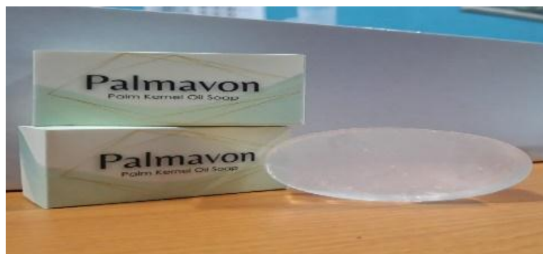
Gambar 5. Visualisasi sabun padat transparan yang dihasilkan

dalam membersihkan minyak atau kotoran lainnya. Hasil uji lemak tidak tersabunkan dari sabun padat transparan yang dihasilkan masih sesuai dengan sabun padat transparan yang beredar dipasaran.