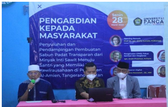
Gambar 1. Pemberian penyuluhan

Pemberian materi dengan metode ceramah, menjelaskan tentang pengenalan CPKB, Fokus Sanitasi dan Hiegienes, Standar Mutu Sabun Padat Transparan, Notifikasi kosmetik yang disampaikan oleh BPOM dan pemasaran digital seperti terlihat gambar 1. Pelaksanaan kegiatan ini secara online dan offline . Peserta yang mengikuti kegiatan ini sebanyak 350 orang. Disamping siswa siswi SMP dan SMA, peserta diikuti oleh pihak luar dari dosen-dosen dan Mahasiswa serta masyarakat umum. Peserta sangat antusias dengan banyaknya pertanyaan yang disampaikan kepada para nara sumber. Sebelum dimulainya penyuluhan, peserta diberikan Pre Test dan pada akhir pelatihan diberikan soal post test . Berdasarkan hasil pre test peserta belum memahami tentang topik PKM dan setelah dilaksanakan penyuluhan diadakan post test . Hasil seperti gambar II. Menunjukkan terjadi peningkatan pemahaman yang baik terkait materi materi yang diberikan, aspek sanitasi terjadi peningkatan dari 62 % menjadi 86%, untuk uji mutu sabun padat, uji mutu dari 52% menjadi 76 dan materi pemasaran digital dari 55% menjadi 88%.