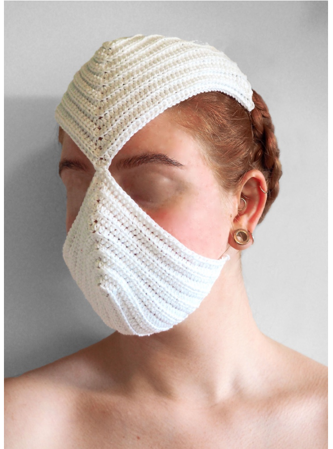
Prosessbilde , heklet tråd, 34x21cm, 2021