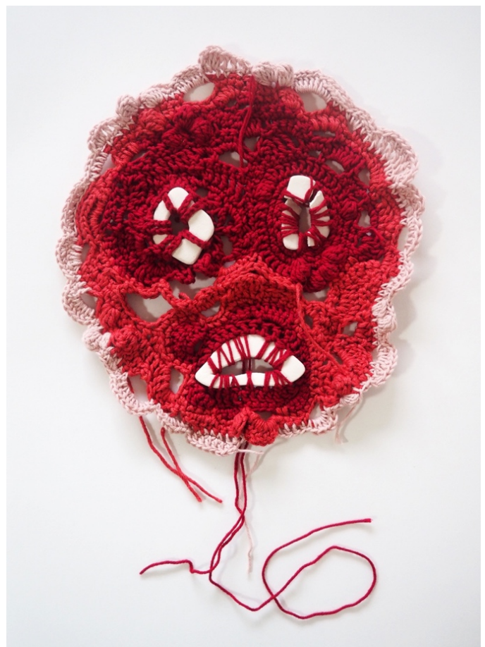
Prosessbilde , heklet tråd, 22x23cm, 2021