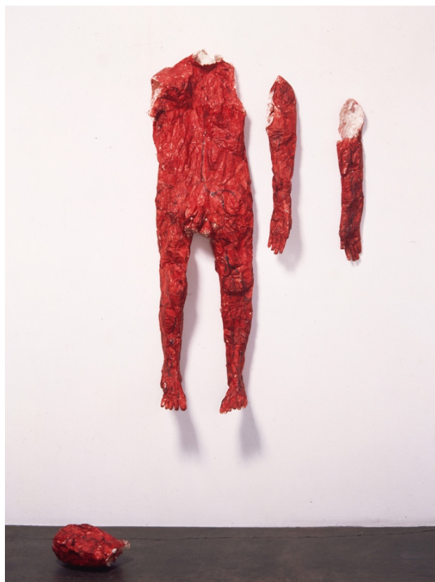
Untitled (red man) , Kiki Smith, 1991, ink on Gampi paper in four parts