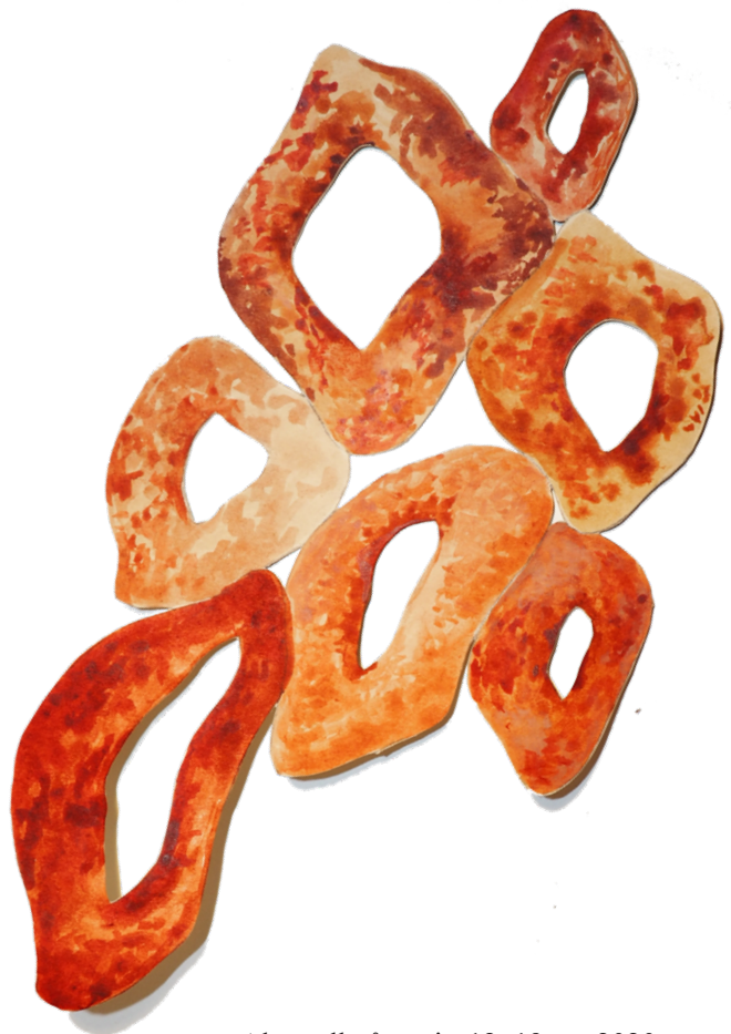
Akvarell på papir, 12x19cm, 2020