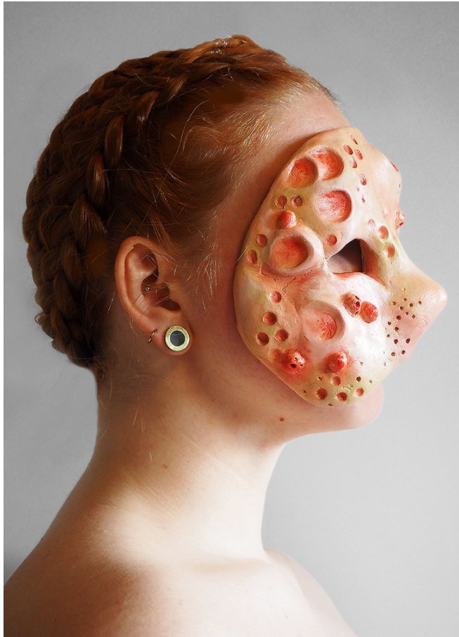
Mashara , pappmasje og akryl, 16x22cm, 2021