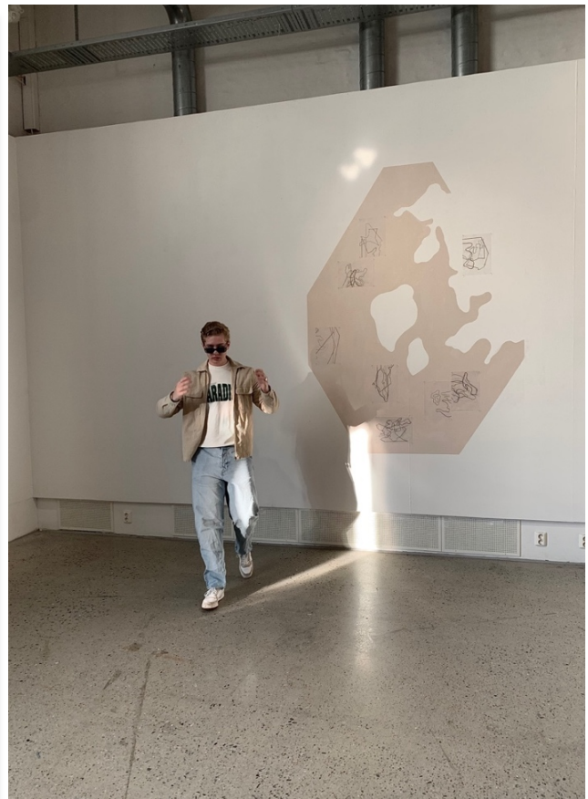
Instagrambilde fra utstillingen (de)konstruert , Seilduken, 2021, akryl, blyant på transparent papir, spiker, ca.170x192cm.