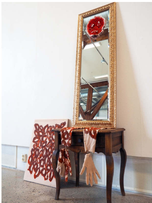
Installasjon, Seilduken, 2021, trykket tekstil, tråd, pappmasje, blindramme, speil og kommode, 245cmx135cmx38cm