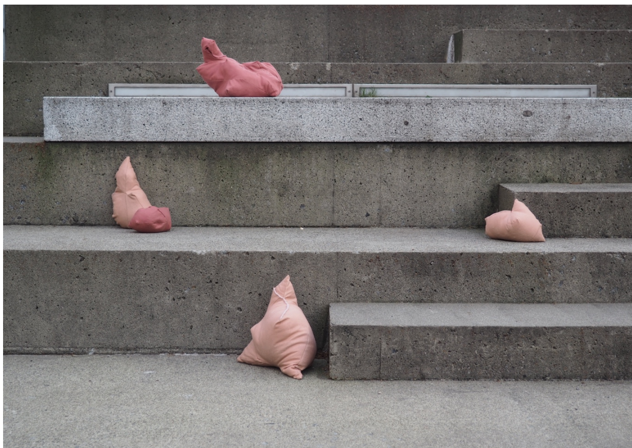
Installasjon- trappene til kunsthøyskolen, tekstil og tørkede erter, dimensjoner fra 18x31x15cm til 12x10x5cm, 2021

Som Westerman så fint sier er det ikke et medium, men heller en rekke relasjonelle spørsmål. Den klassiske måten å tenke performance, om man kan si at det er en klassisk metode, er ikke nødvendigvis retningen jeg ønsker å gå. Performativitet former kjernen for interessene mine, og fortsetter å være en del av tankene og arbeidsmetodene mine rundt kunst.