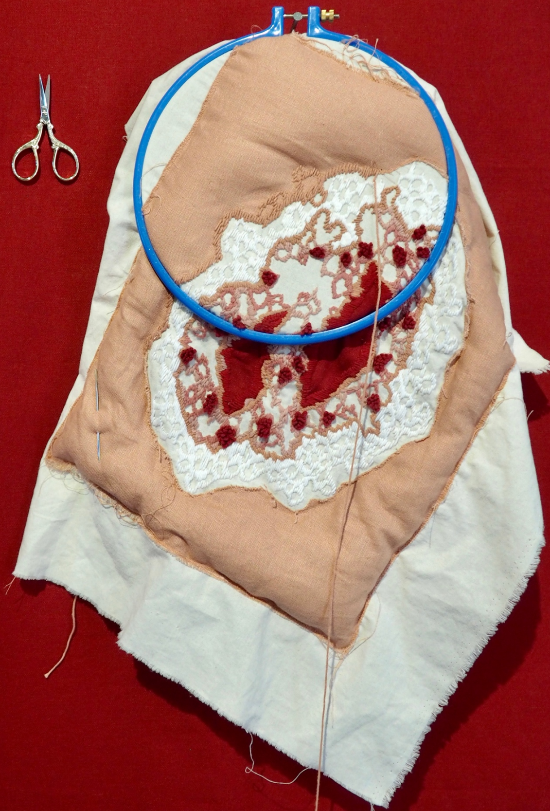
Kirurgisk sutur, detaljbilde installasjon, Seilduken 2021, ca. 150x300cm