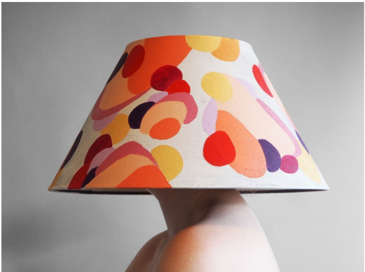
Kamuflert påfugl, akryl og lampeskjerm, 45x45x25cm, 2021

Peacocking betyr å kle seg for oppmerksomhet, på samme måte som påfugler bruker fjærene sine for å tiltrekke en make. (Urban Dictionary, 2006) Fillers, vippe-extensions og tannblekning er en utbredt samtidsmaske. Man gjør seg del av sin uvalgte flokk. Her vil du være kamuflert for egen sosiale krets, men skille deg ut for de utenfor. I alle mulighetene for individualisering vil vi alltid flokke oss, fordi tilhørigheten av andre mennesker er sterkere. Sosiale medier blir bordet vi samles rundt for å vise oss frem, men kanskje aller mest se på andre. Surret inn i algoritmer, og påfugl fjær.