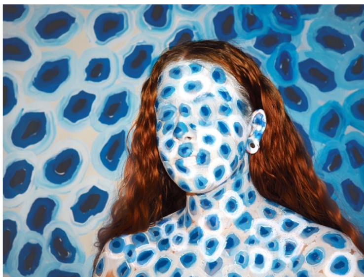
2020, isenesettelse, digitalt foto