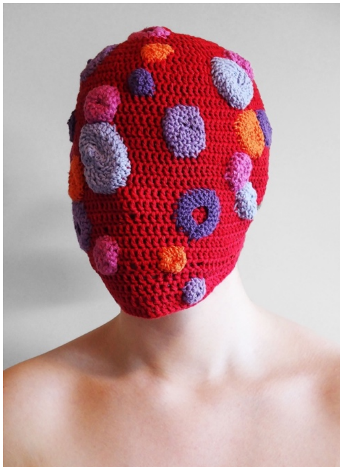
Vrengt , Heklet tråd, ca 29x27cm, 2021