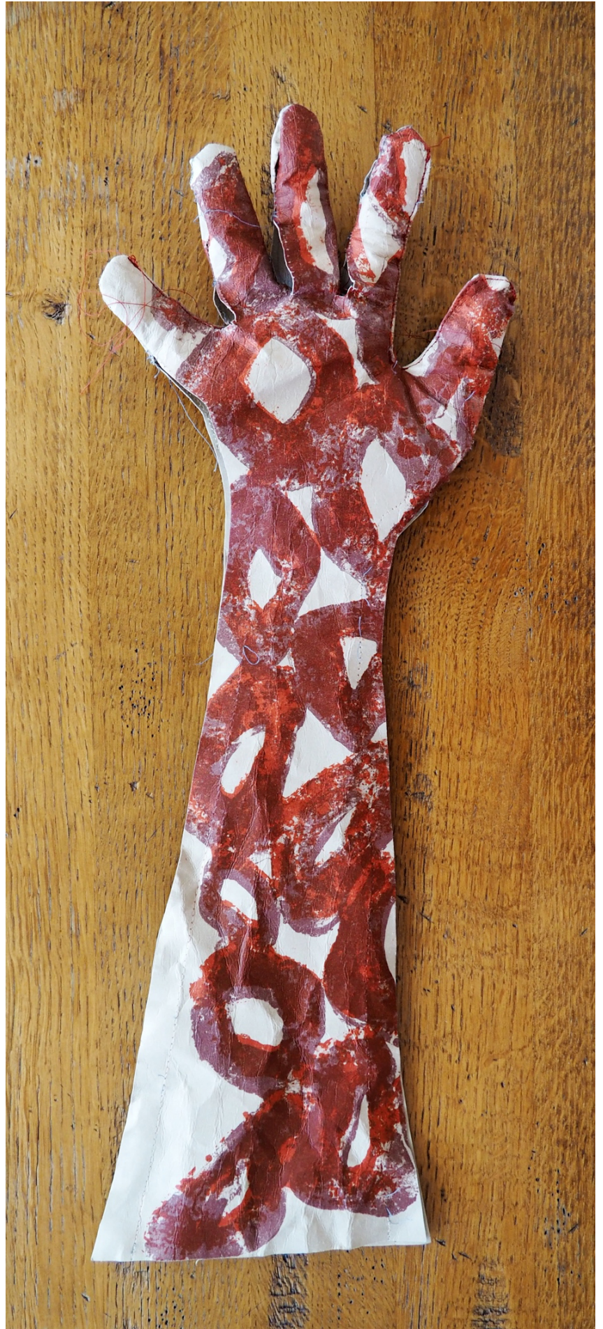
Litografi på vegansk skinn, tråd, 15x55cm, 2020

men ikke ripene i gulvet eller flekkene i duken