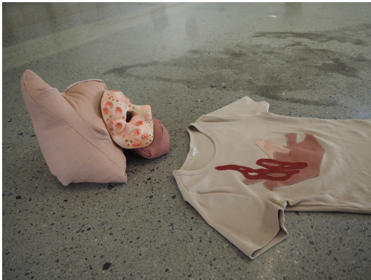
(de)konstruert, Seilduken, installasjon, tekstil og pappmasje, 2021

Opprinnelsen til ordet maske er noe uklart, men man antar at det stammer fra det arabiske ordet «Maskhara/Mashara» som betyr å forfalske eller transformere noe til dyr, monster eller vanskapning. Egypterne brukte ordet maske til å referere til lær eller «second skin». (Nunley & Mccarty, 1999)