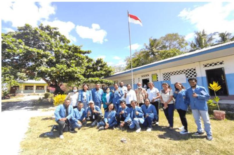
Gambar 2. Kunjungan awal ke SDI Wedomu dan permintaan kerjasama dengan sekolah mitra

Kegiatan pengajaran dan pendampingan kelompok belajar dilakukan secara tatap muka dan dimulai dengan permintaan kerjasama dengan sekolah mitra.