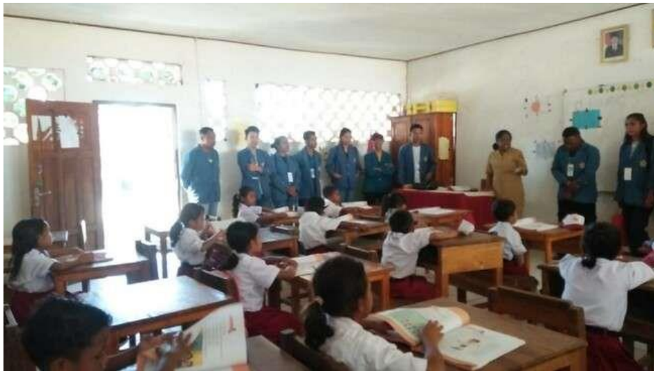
Gambar 3. Guru memperkenalkan mahasiswa peserta KKN kepada siswa/i di kelas.

Kunjungan pertama diterima dengan baik oleh pihak sekolah dan saat itu pula terjadi kesepakatan kerjasama untuk pelaksanaan program pengajaran dan bimbingan belajar siswa/i SDI Wedomu dengan sasarannya adalah siswa kelas 1 sampai dengan kelas 4. Alasan utama memilih sasaran secara spesifik adalah hasil observasi menunjukkan bahwa siswa kelas 1-4 sangat membutuhkan bimbingan dalam belajar karena sebagian besar proses belajarnya menggunakan metode daring. Program pengajaran dan pendampingan belajar tidak hanya terjadi saat berada di kelas tetapi berlanjut saat sore hari dalam bentuk pendampingan kelompok belajar. Pelaksanaan pengajaran dan pendampingan belajar dilakukan setiap hari kerja selama 10 hari, sesuai dengan kelompok dan jadwal mengajar yang sudah dibagikan.