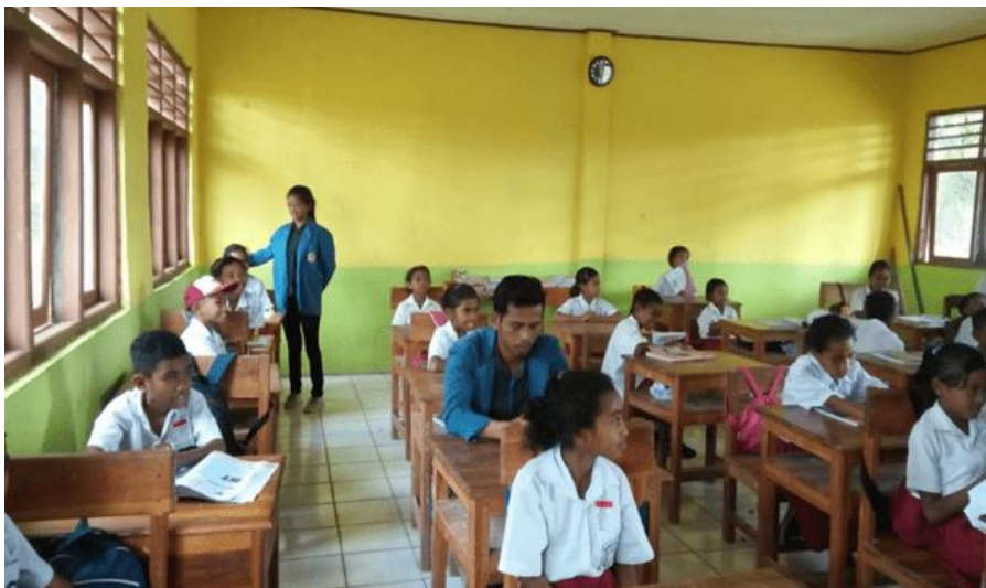
Gambar 4. Melaksanakan pengajaran dan pendampingan belajar

Kunjungan pertama diterima dengan baik oleh pihak sekolah dan saat itu pula terjadi kesepakatan kerjasama untuk pelaksanaan program pengajaran dan bimbingan belajar siswa/i SDI Wedomu dengan sasarannya adalah siswa kelas 1 sampai dengan kelas 4. Alasan utama memilih sasaran secara spesifik adalah hasil observasi menunjukkan bahwa siswa kelas 1-4 sangat membutuhkan bimbingan dalam belajar karena sebagian besar proses belajarnya menggunakan metode daring. Program pengajaran dan pendampingan belajar tidak hanya terjadi saat berada di kelas tetapi berlanjut saat sore hari dalam bentuk pendampingan kelompok belajar. Pelaksanaan pengajaran dan pendampingan belajar dilakukan setiap hari kerja selama 10 hari, sesuai dengan kelompok dan jadwal mengajar yang sudah dibagikan.