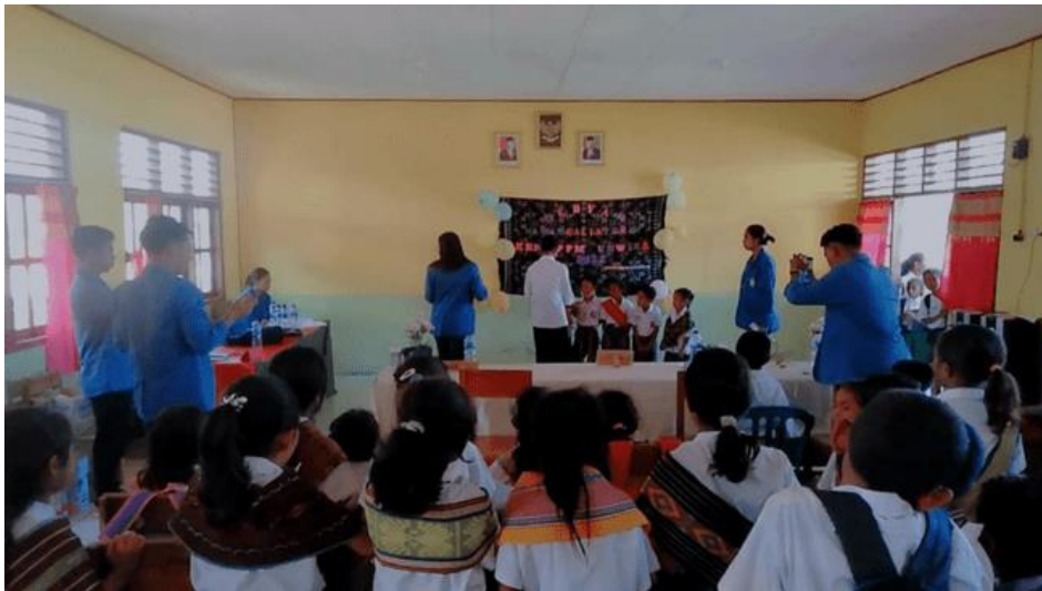
Gambar 5. Pelaksanaan gebyar literasi dan penyerahan sertifikat serta hadiah bagi siswa yang juara oleh kepala sekolah SDI Wedomu.

Pelaksanaan gebyar literasi merupakan rangkaian akhir dari program pengajaran dan pendampingan kelompok belajar sekaligus evaluasi bagi mahasiswa peserta KKN. Berdasarkan hasil lomba yang diikuti oleh siswa/i kelas 1-4 menunjukkan bahwa walaupun belum maksimal namun motivasi belajar akhirnya berangsur kembali setelah melewati proses belajar dari yang cukup lama. Selain itu, rangkaian program ini merupakan pembelajaran dan pengalaman bagi mahasiswa terlebih dalam mengembangkan kemampuan bersosialisasi dalam masyarakat dan berbagi ilmu yang diperoleh selama berada dibangku perkuliahan.