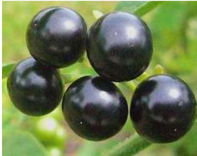
Gambar 2 Citra Leunca Uji

tingkat kematangan dilakukan dengan citra sampel uji citra leunca dengan klasifikasi tingkat kematangan mentah. Adapun berikut adalah citra sampel uji yang akan dideteksi tingkat kematangannya :