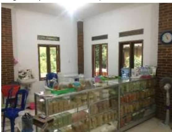
Gambar 5. Rumah Serba Singkong

“Untuk keuntungan, kami sebagai anggota menggunakan sistem gaji untuk membayar upah yang sudah disepakati dari awal dan tidak dibagi rata kepada seluruh anggota. Untuk hasil keuntungannya, kami masukkan ke kas. Hasil dari kas tersebut bisa kami gunakan untuk memutar kembali uangnya dalam bentuk bahan, alat, dan akomodasi yang lainnya. Selain itu kas juga kami gunakan untuk diberikan sebagian kepada adat apabila ada upacara, atau acara yang membutuhkan uang dalam jumlah banyak”. (wawancara dengan W pada 9 Juli 2022)