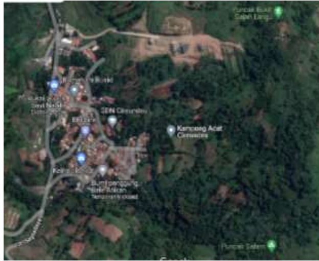
Gambar 3. Landscape Cireundeu, Cimahi

Mengutip dari website resmi Kota Cimahi, Cireundeu memiliki 367 kepala keluarga dengan rincian 550 jiwa perempuan dan juga 650 jiwa merupakan laki-laki.