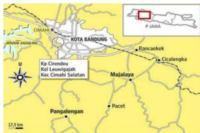
Gambar 2. Peta Kota Cimahi

Kampung Cireundeu merupakan salah satu komunitas adat yang terletak di kelurahan Leuwigajah, Kecamatan Cimahi Selatan Kota Cimahi. Hal ini berdasarkan tentang pembentukan Kota Cimahi. Kampung Cireundeu berada di perbatasan antara Kota Cimahi dengan Kabupaten Bandung Barat, tepatnya dengan Kecamatan Batujajar. Jarak dari Cireundeu ke Kelurahan Leuwigajah sendiri adalah 3 Kilometer dan 6 Kilometer ke kantor Pemerintah Kota Cimahi.