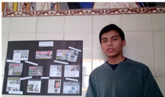
Figura 3. La noticia de la semana