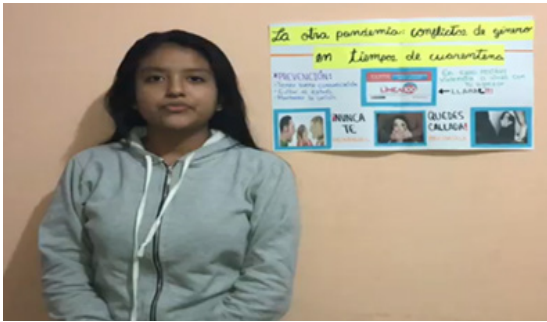
Figura 1. Tengo algo que decirte