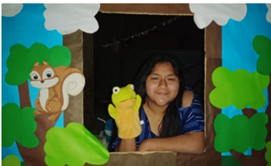
Figura 7. Teatro de títeres