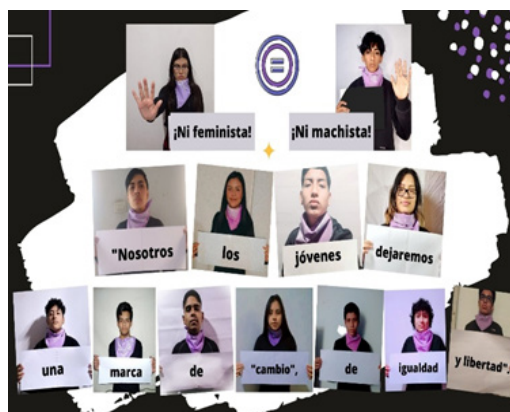
Figura 13. Mi selfie grupal