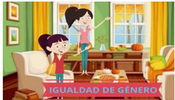
Figura 6. Mi audiocuento preferido