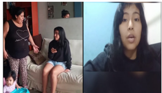
Figura 4. Mi corto sobre la No violencia