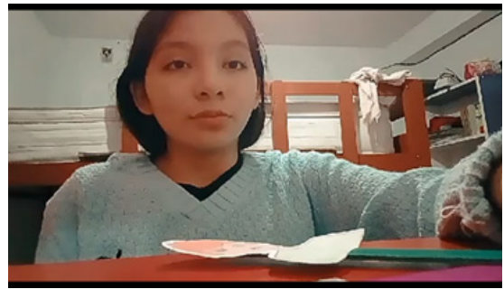
Figura 2. Mi historia de vida