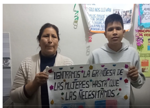
Figura 11. Mi mensaje familiar