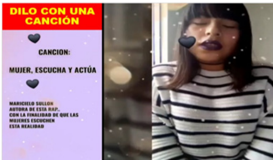
Figura 5. Dilo con una canción