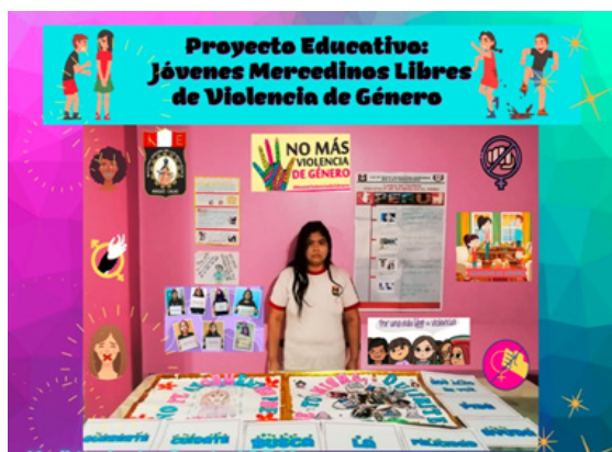
Figura 12. Mostrando mis evidencias