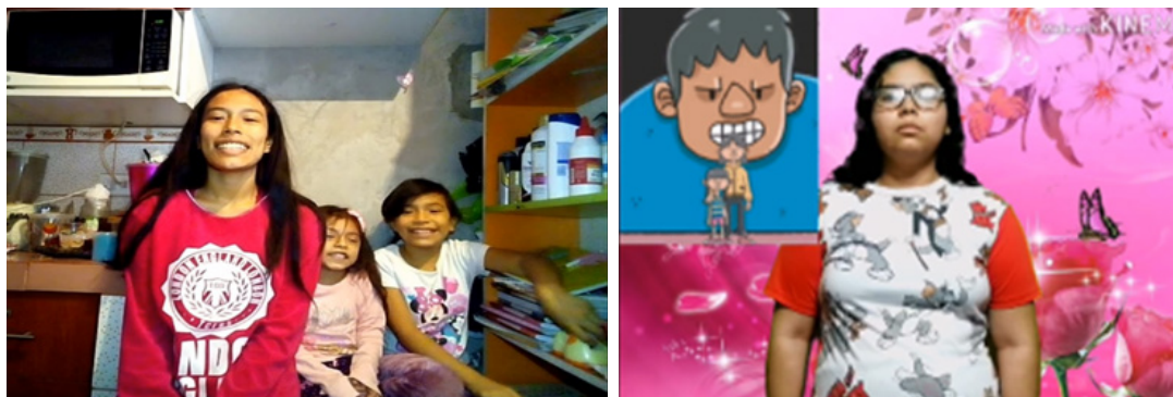
Figura 9. Spot publicitario