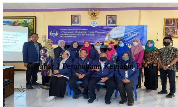
Gambar 1 Pembukaan Kegiatan PKM