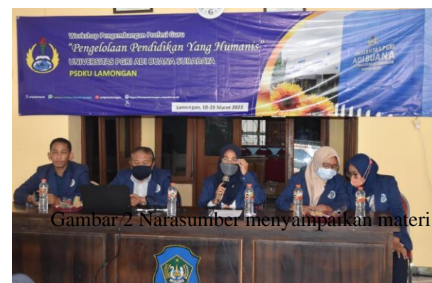
Gambar 2 Narasumber menyampaikan materi