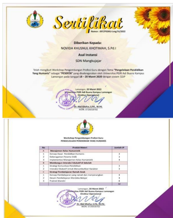
Gambar 4 Contoh sertifikat workshop

Selain itu sekolah sebaiknya bersinergi dengan orang tua dan masyarakat, agar proses pendampingan belajar siswa bisa terfasilitasi dengan baik. Misalnya, membentuk forum orang tua dan melibatkan orang tua dalam beberapa proses belajar putra-putrinya. Hal ini bertujuan untuk mengoptimalkan pendidikan humanistik.