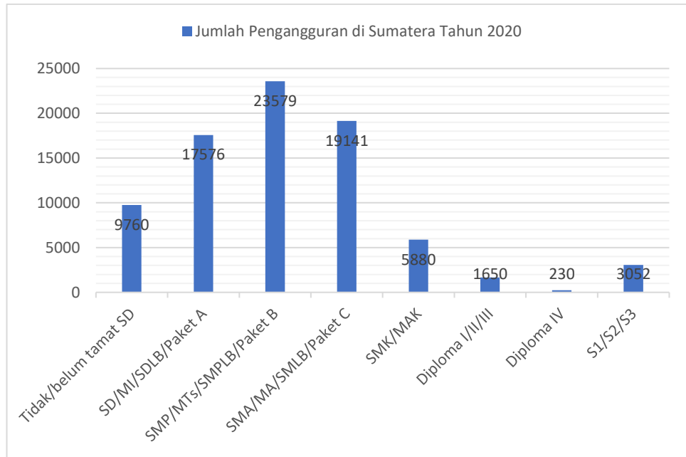
Gambar 1. 1 Grafik Jumlah Pengangguran Berdasarkan Tingkat Pendidikan di Sumatera tahun 2020