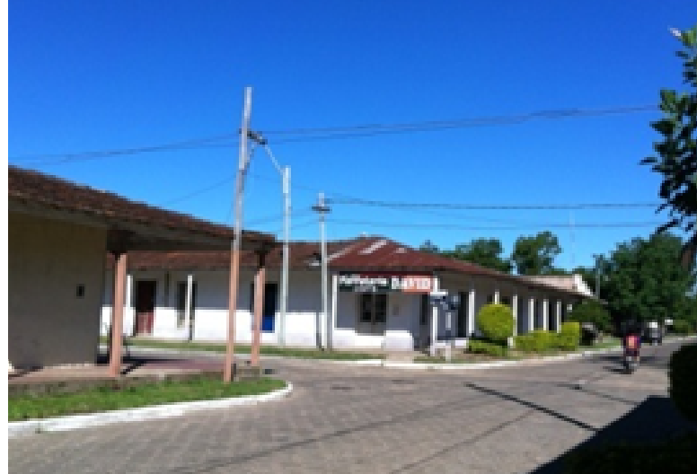
Foto 1. Arquitectura Colonial / Casa Galería exterior.

Resulta visible que el valor ambiental del paisaje urbano estuvo en la propuesta de las construcciones de casas de corredores exteriores cumpliendo las exigencias climáticas, calles pavimentadas y de arena. Gran parte de la edificación en tierra resistió al paso del tiempo, donde el espacio cubierto hacia la vereda urbana, pervive y se repite, en muchos casos con variantes, pero con una clara lectura en el paisaje de los procesos histórico atravesados por el poblado y perviven como testimonio, memoria y legado patrimonial.