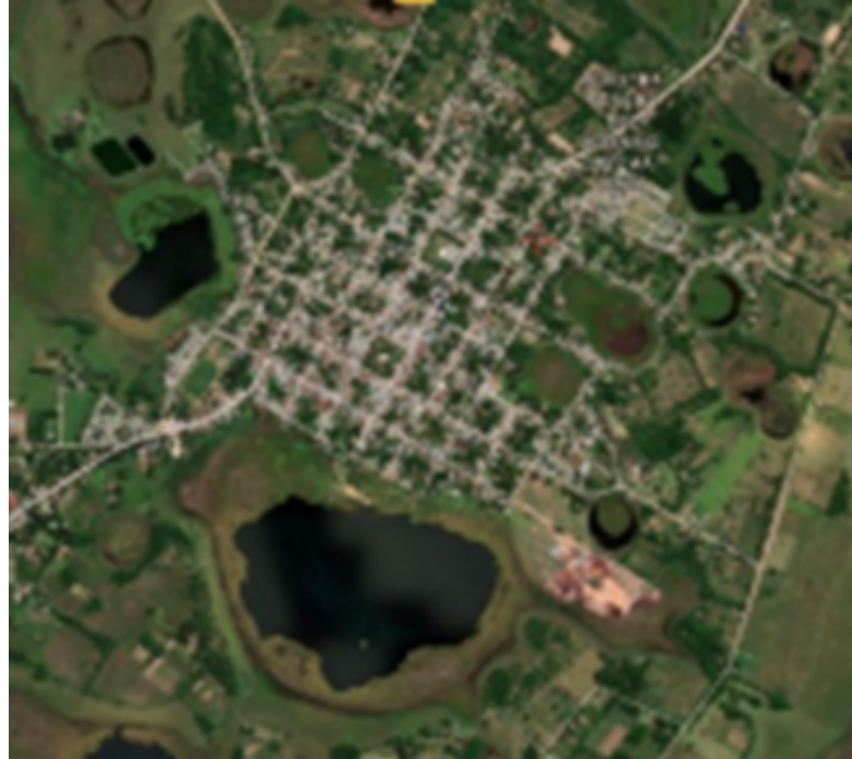
Fig. 2. Planta Urbana – Vista Satelital.

[2] Sánchez Negrette, Ángela. Tren "El Económico". Su gravitación en los poblados correntinos. CEHAU-FAU-UNNE. 1995.