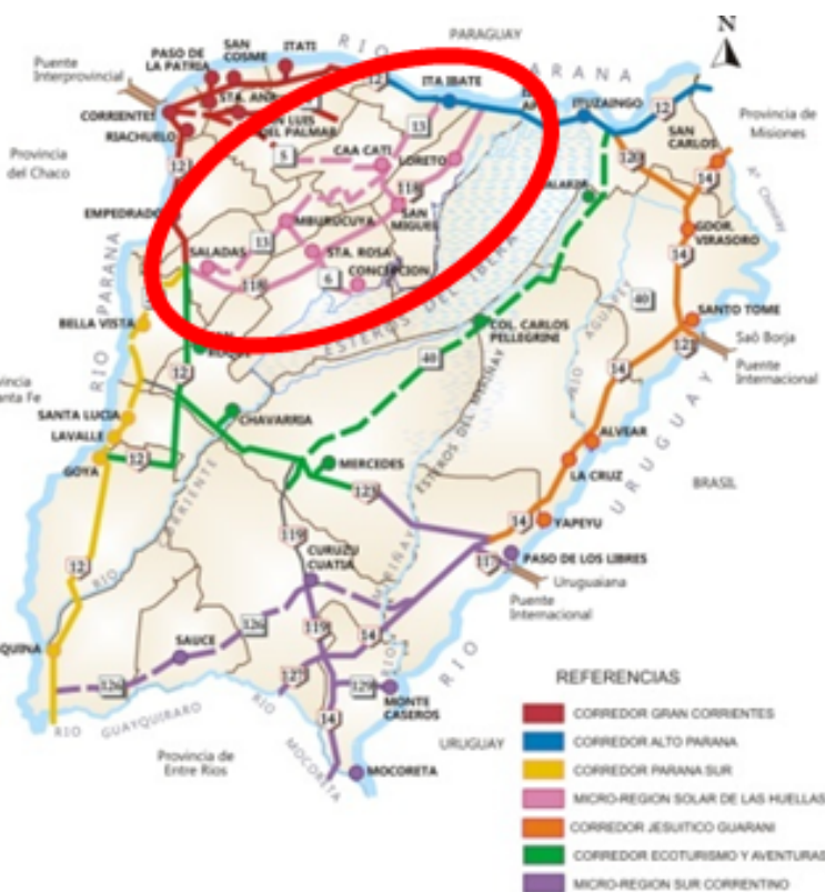
Fig. 4. Trazado Corredores Turísticos.

[3] Nogué, J. (ed.). (2007-2009). “La Construcción Social del Paisaje”. Ed. Biblioteca Nueva. Colección Paisajes y Teoría. Madrid, España.