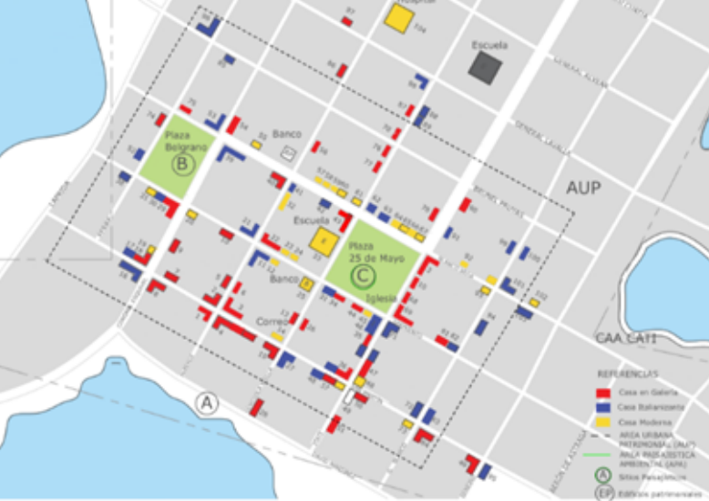
Fig. 3. Planta Urbana.