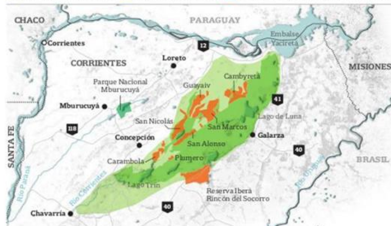
Fig. 5. Plano Región. Parque Nacional Mburucuyá y Reserva Provincial del Iberá.

[4]Ordenanza 17-14. Sancionada en la Sala de Sesiones del Honorable Concejo Municipal el 05 de diciembre del 2014, en la ciudad de Caá Catí, Provincia de Corrientes, Argentina.