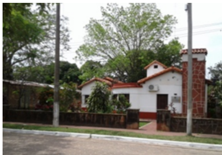
Foto 3. Arquitectura Moderna / Casa Chalet Californiano.

Fuente: “Atlas Patrimonio”. 2013-2017. Colección CEHAU.