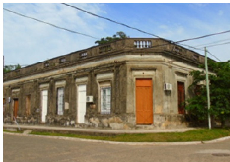
Foto 2. Arquitectura Italianizante Ecléctica / Vivienda.

Fuente: “Atlas Patrimonio”. 2013-2017. Colección CEHAU.