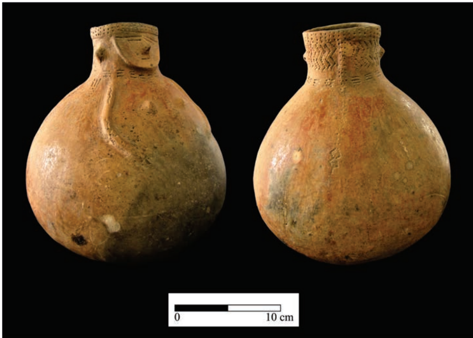
Figura 2. Recipiente hallado en las proximidades del arroyo Bragado, norte de Coronda.