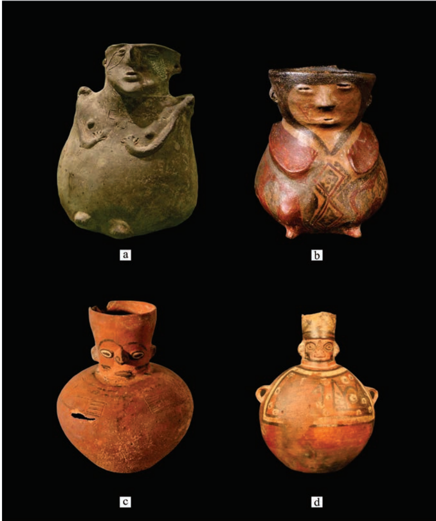
Figura 4. Recipientes tipo “cara-gollete”. (a) Cultura Candelaria, Tucumán, Argentina, ca. 500-1000 AD (Colección de la Cancillería Argentina); (b) Cultura Arica, Chile, ca. 1100-1200 AD (Museo Chileno de Arte Precolombino); (c) Pachacamac, Perú, período Inka (Museo de Sitio de Pachacamac); (d) Cultura Wari-Tiwanaku, ca. 700-1100 AD (Museo Chileno de Arte Precolombino).