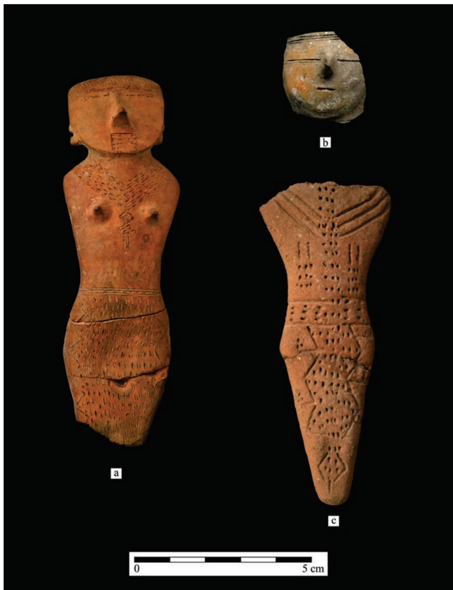
Figura 3. Representaciones antropomorfas de Sierras Centrales: (a) Figurina de Río Segundo (Museo Jesuítico Nacional, Jesús María, Córdoba); (b) Fragmento de recipiente de Cosquín (Museo Camín Cosquín); (c) Figurina de Río Segundo (Museo Arqueológico Provincia Aníbal Montes, Río Segundo, Córdoba).